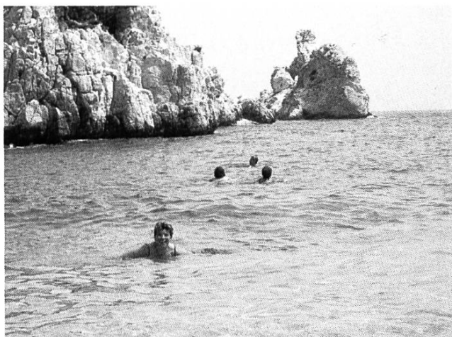
Baden im herrlich kühlen Meer