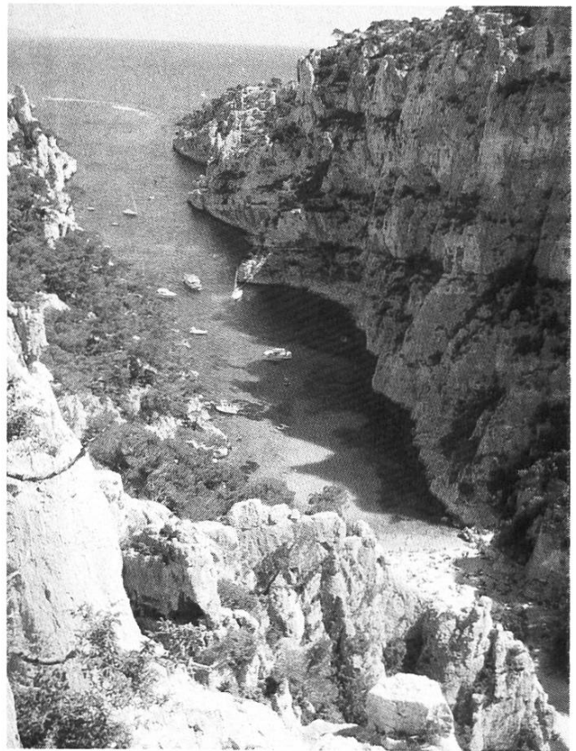
Blick von der letzten Seillänge in die Calanque En Vau

Aus dem schattigen, angenehm kühlen Felsloch kletterte ich auf den Grat Richtung Ausstieg. Die Sicht ist einmalig. Vom luftigen Grat blickt man direkt ins türkisblaue Wasser der Calanque En Vau. Einige Stunden zuvor sind wir selber noch im erfrischend kalten Meerwasser geschwommen. Und nun befinde ich mich etwa 200 Meter über der Bucht und geniesse den Ausblick. Am sonnigen Felsen ist es fast zu warm. Zum Glück weht ab und zu eine sanfte Brise um den ausgesetzten Grat. Gegen ein kühles Bad hätte ich aber gar nichts einzuwenden... Der letzte Klettertag neigt sich dem Ende entgegen.