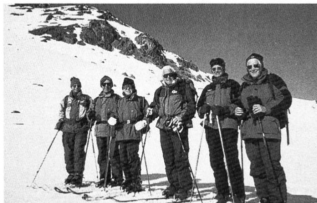
Die Teilnehmer der B-Skitourenwoche