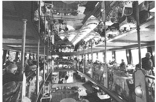
Schönes Ambiente an Bord