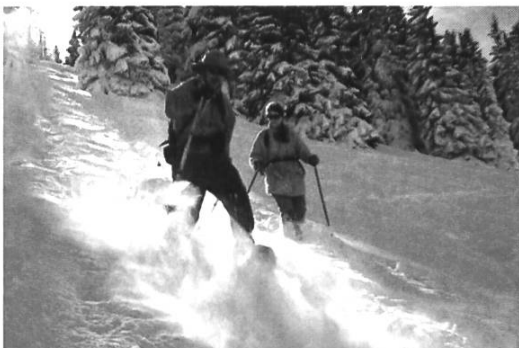
Abstieg im Pulverschnee

Von Schwarzsee Gypsera ostwärts folgt man dem Riggisbach parallel aufwärts und zweigt nach dem Wald zum Hüttli bei Hürlisboden ab. Von dort über den nördlich gelegenen Graben und in direkter Linie auf den Grat – zu Anfang steil – zum Gipfel des Hohmattli. Dem Grat logisch folgen bis zum Waldende und von hier genau nördlich hinab in den Sattel bei P 1485. Durch offenen Wald auf den Aettenberg hinaufsteigen. Nun immer auf dem Grat bis zum Stoos (1513m), von wo der Abstieg steil nordwestlich beginnt. Vorzugsweise über Grundbergera und Wissenbachera und die steile Abschlusswiese hinunter auf die Strasse von Sangernboden, der man noch kurz bis Zollhaus folgt. Achtung: Beim Aufstieg nicht in das kleine Skigebiet von Kaiseregg queren.