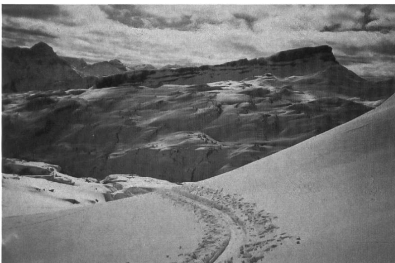
Hoher Ifen mit Karrenfeldern des Gottesackers

Dienstag, 14. Februar: Mit dem Bus fahren wir heute vorerst bis zum Ortsteil Wäldele. Von dort folgen wir einem langen Waldweg zum Schmalzboden und