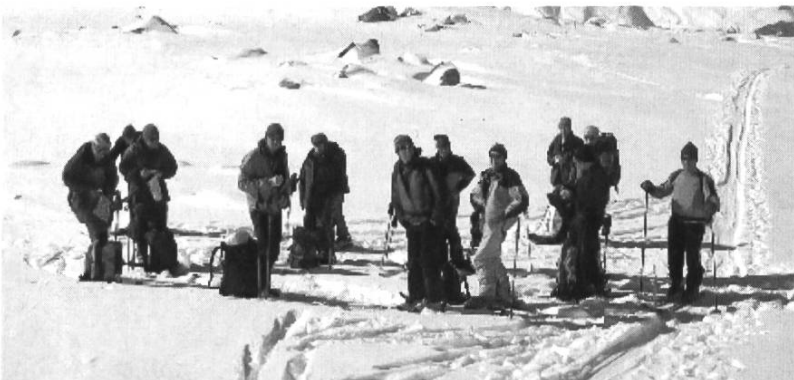
Marschhalt beim Aufstieg aufs Mittagshorn.