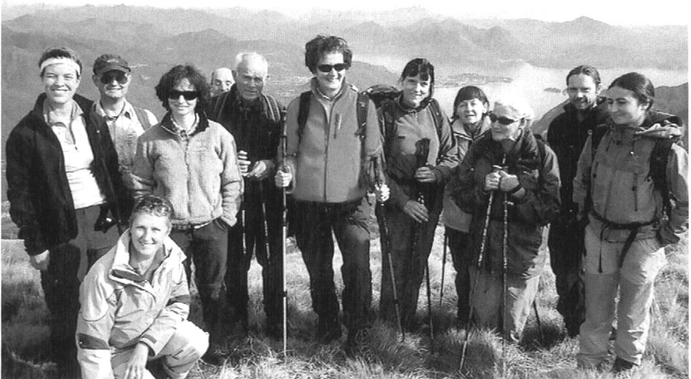
Gruppenbild auf dem Gipfel des Monte Cerano mit Seenlandschaft.

Bereits in der Morgenfrische trifft sich die muntere Gruppe auf dem Abfahrtsperon in Bern. Für einige war das Frühaufstehen schon hart, für andere weniger. An verschiedenen Bahnhöfen stossen immer mehr Teilnehmende dazu, bis wir schlussendlich komplett sind. Pünktlich kommen wir mit der italienischen Staatsbahn FS in Verbania an. Ebenso pünktlich steht Taxifahrer Omar mit zwei weiteren Kollegen und ihren Fahrzeugen bereit, um uns auf die andere Talseite zur Aussenwacht Arzo zu bringen.