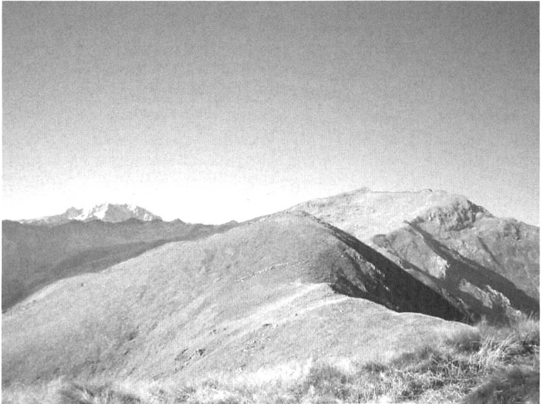
Blick vom Cerano westwärts mit Monte Rosa linkerhand und rechts grasbedeckt dem Monte Massone (Foto nachgestellt).

Unverzüglich, aber gemächlich gehts aufwärts durch lichte Kastanienwälder. Stetig gewinnen wir an Höhe, sukzessive wird der Blick auf die malerische Seenlandschaft frei. Das schöne Wetter und die angenehme Temperatur erlauben uns, diesen goldenen Herbsttag voll geniessen zu können. Wir kommen gut voran, obwohl wir an schönen Plätzchen auch genüssliche Pausen einlegen. Wegen dem uneinsehbaren Gelände und den unzähligen Abzweigungen ist Disziplin gefragt. Wir müssen beim Gehen zusammenbleiben, aber das meistert unsere Gruppe mit Bravour. Mit der Zeit lichtet sich der Wald und wird sukzessive durch offene Weiden abgelöst. Endlich liegt der Gipfelhang vor uns, mögen einige gedacht haben. Unsere Beinmuskeln werden ein letztes Mal stärker gefordert.