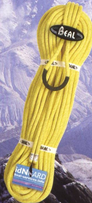
Dynamisches Bergseil Joker SD 9,1 mm von Beal CHF 198.- (50 m) bis 284.- (70 m)

Ihr Ausrüster fürs Bergsteigen, Klettern und Wandern. Kompetente Beratung. Zuverlässiger Service. Grösste Auswahl. Faire Preise.