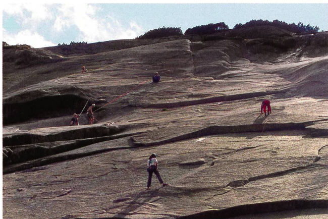
Reges Klettern an der Azalee Beach.