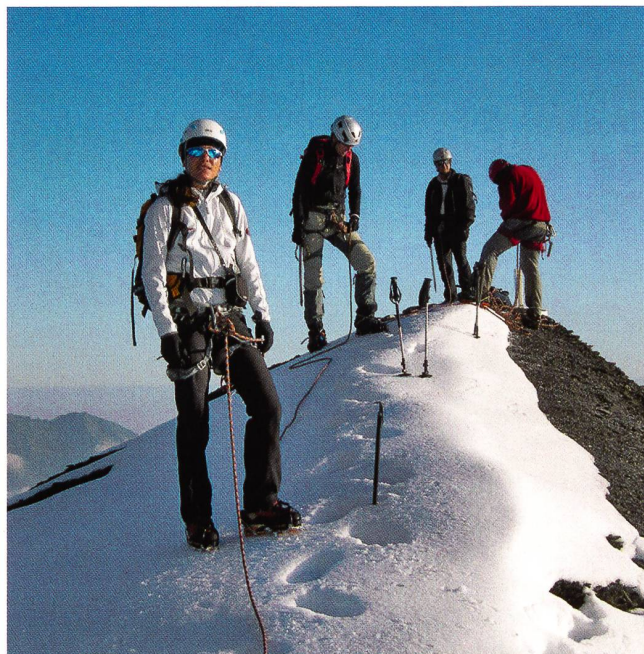
Modernes Bergsteigen (Foto Stephan Wondrak).