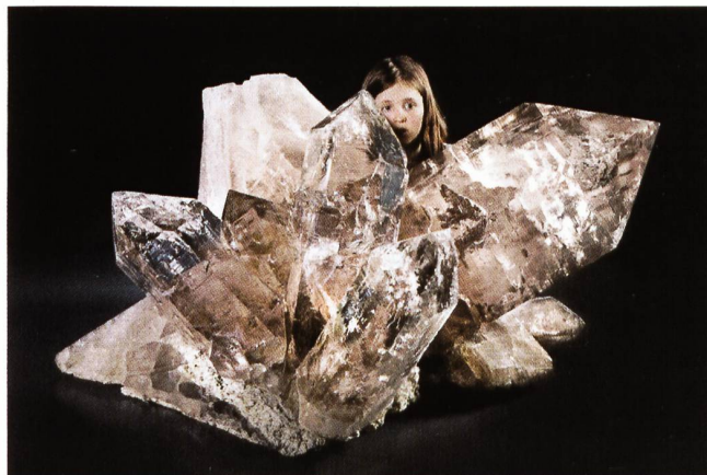
Planggenstock Kristallstufe – man beachte den Massstab – Kindergesicht