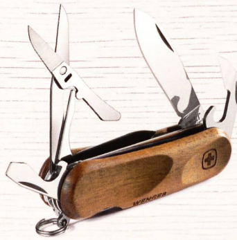
EvoWood 14 Griff aus Schweizer Nussbaumholz 13 Funktionen