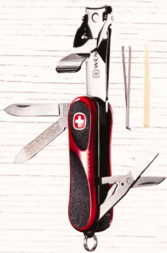
NailClip EvoGrip 580 9 Funktionen