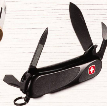
Blackout 10.P2 Griff mit rutschhemmender Gummieinlagen und Werkzeuge mit tiefschwarzer PVD Beschichtung 14 Funktionen