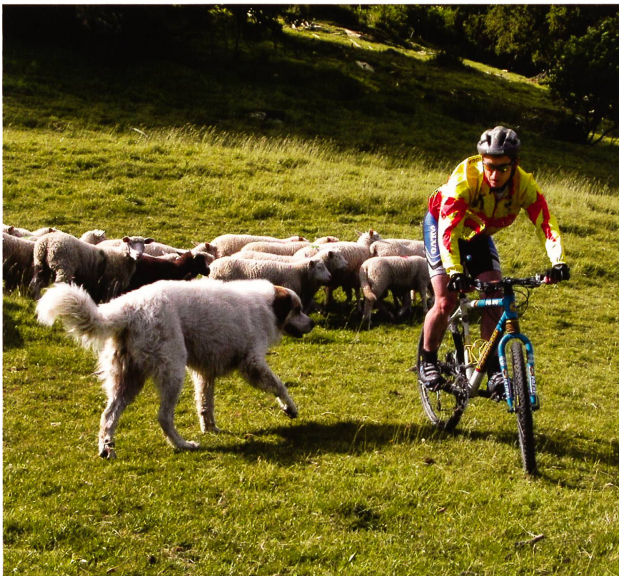
Keine gute Idee.

Ein in seiner Form unerwarteter positiver Aspekt des Zertifizierungsprozesses war die Tatsache, dass dieser mehr oder weniger automatisch zur Förderung des Umweltbewusstseins beitrug. Alle im Projekt involvierten