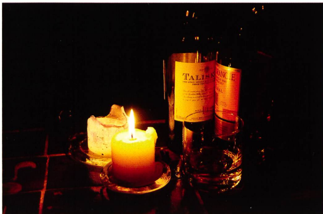
2. Preis «Kerzen und Gläser»; Iain Campbell.