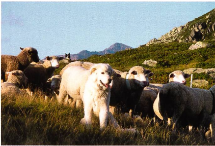
Heute werden in den Schweizer Alpen bereits rund 200 Herdenschutzhunde eingesetzt, Tendenz steigend.

Beim Bergsport lässt sich normalerweise recht einfach zwischen einer objektiven Gefahr – Steinschlag, Sturm, Gletscherspalte usw. – und einer subjektiven – Selbstüberschätzung, unzureichende Kondition usw. – unterscheiden. Während die einen ausserhalb des menschlichen Beherrschungsvermögens liegen, entstehen die andern aus menschlichem (Fehl-)Verhalten. Begegnungen mit Herdenschutzhunden werden von Wanderern und Bikern subjektiv oft als gefährlich wahrgenommen, auch wenn objektiv in den allermeisten Fällen keine Gefahr besteht. Diese etwas paradoxe Situation ist jedoch sehr verständlich, denn die imposante Statur der Hunde und ihr energisches Gebell können durchaus furchteinflössend sein. Und dies zu Recht: Herdenschutzhunde sind zwar weder besonders aggressive Hunde noch sind sie gar Wildtiere, aber ihr Einsatzzweck ist der Schutz von Schaf-, Ziegen- oder ausnahmsweise auch Rinderherden gegenüber Angriffen von Grossraubtieren wie Wolf, Luchs oder Bär. Und die Schutzwirkung beruht weitgehend auf dem abschreckenden Abwehrverhalten der Hunde. Wenn sich nun der Mensch völlig falsch verhält (subjektive Gefahr), so kann er vom Herdenschutzhund als Bedrohung für seine Herde wahrgenommen werden. Und dies kann zu einer insofern gefährlichen Situation führen, als dass das Risiko besteht, geschnappt oder gar gebissen zu werden.