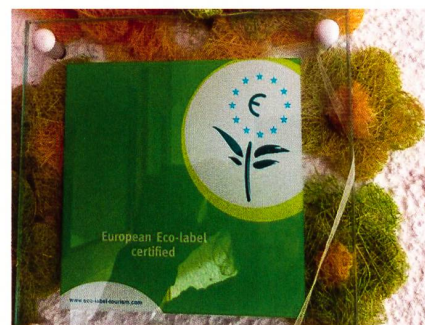
Das EU Ecolabel.