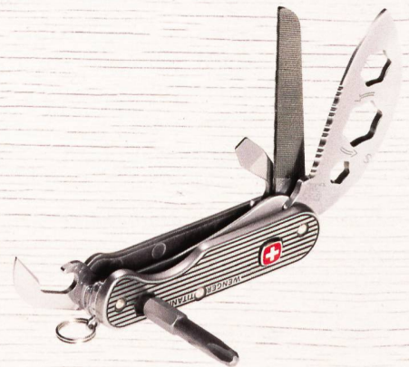
Titanium Line Ueli Steck Special Edition 17 Funktionen