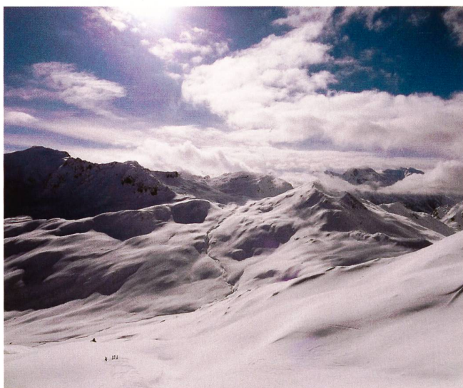
Der zweite Tag begann mit einer Traumabfahrt von der Bergstation Mot Scalotta zum hintersten Talboden des Septimertals.