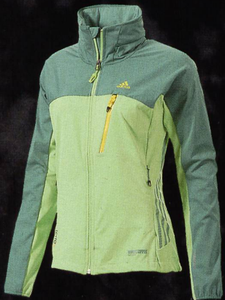
ADIDAS Fast Jacket