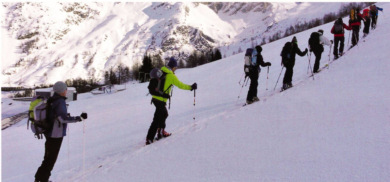
Aufstieg zum Mäderhorn.

Skitouren im Simplongebiet; vom 23. bis 26. Februar 2013