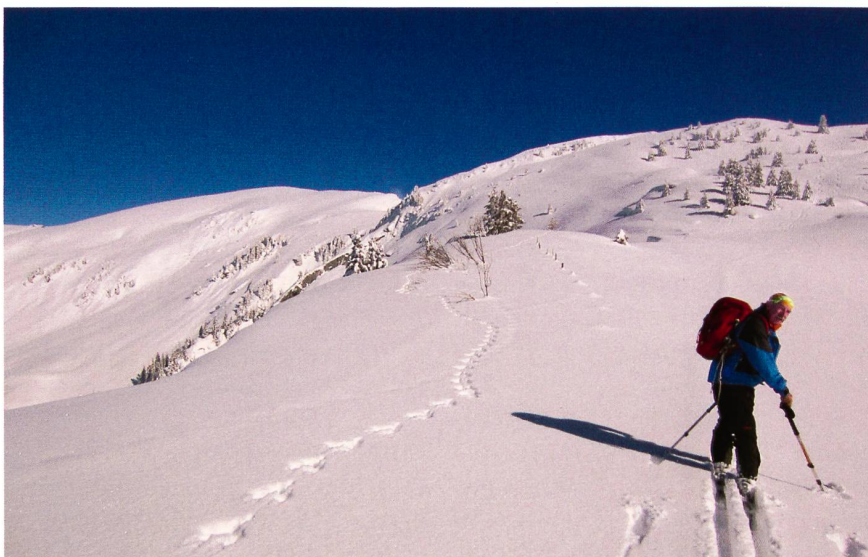
Die Belohnung – 2.

Bei der Abfahrt ist eine ganz wichtige Aufgabe an Elias delegiert worden: Er macht den Schluss und muss immer wieder kontrollieren, dass er seine 16 Schäfchen beisammen hat. Es fahren alle schön und zuverlässig, ziehen wunderbare Spuren in den Pulver, es hat Platz zum Verschwenden. Und doch: Was hören da die Tourenleiter-Ohren: Für die einen oder andern hat es sogar fast zu viel Pulver, oder sind nur die Hänge zu wenig steil, um eine lockere Abfahrt zu ermöglichen? Egal, schlussendlich sind alle glücklich, müde aber gesund wieder unten in Blankenburg. Nach einer unfreiwilligen Pause in Zweisimmen, die zwangsläufig (glücklicherweise) in der Beiz verbracht wird, bringt uns der ÖV wieder sicher zurück nach Hause.