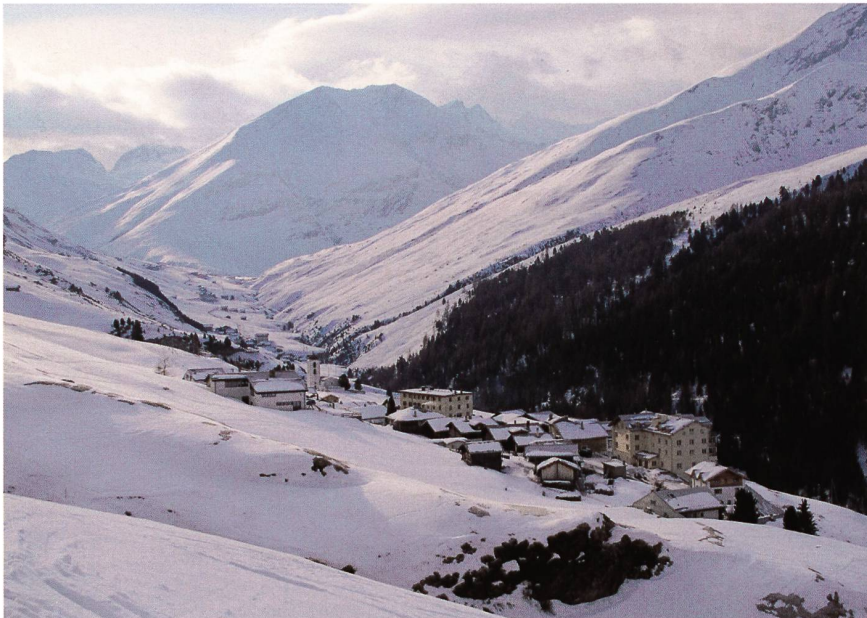
Avers-Cresta, rechts Hotel Capetta.