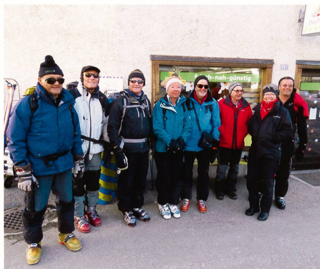
Unsere Gruppe in Bivio.