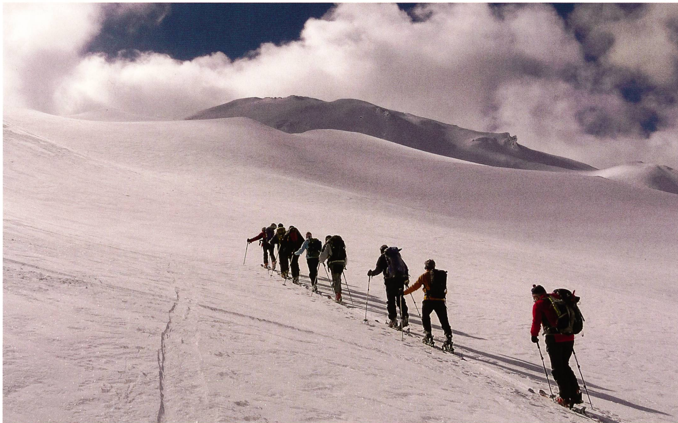
Aufstieg zum Piz dal Sasc.

Traumtouren um Bivio; vom 12. – 16. März 2013