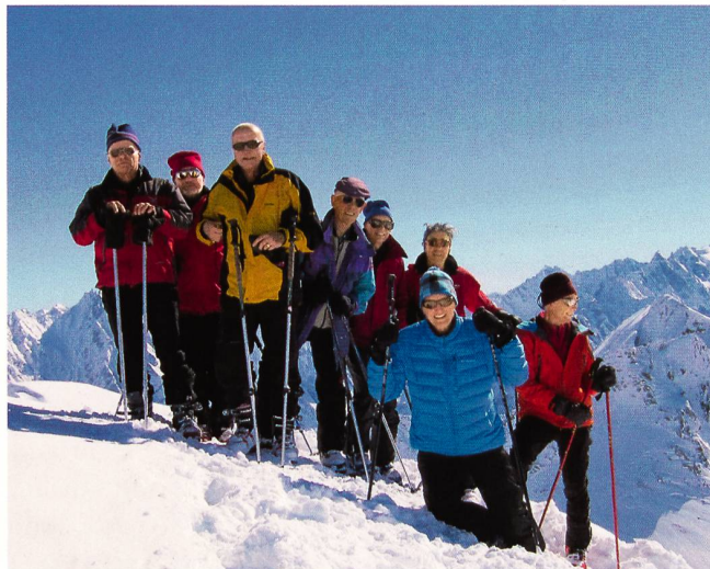
Veteranen auf dem Piz Turba.