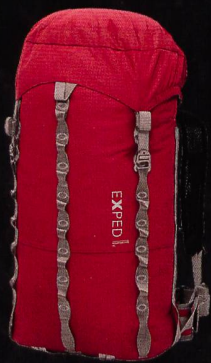
EXPED Mountain Pro