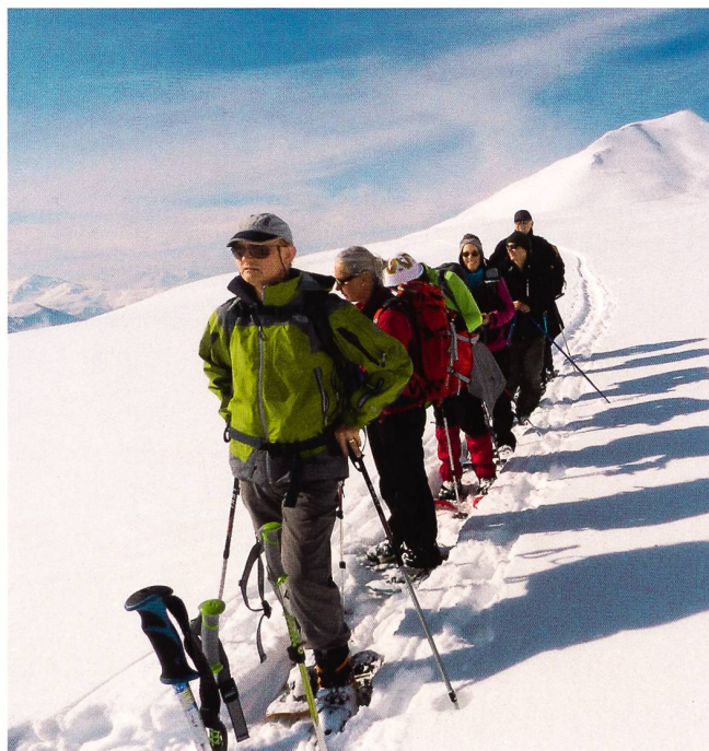
Uf em Wäg.