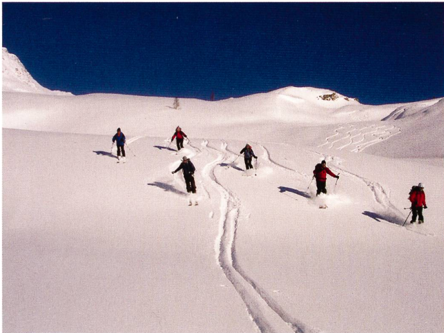
Abfahrt zum alten Hospiz.