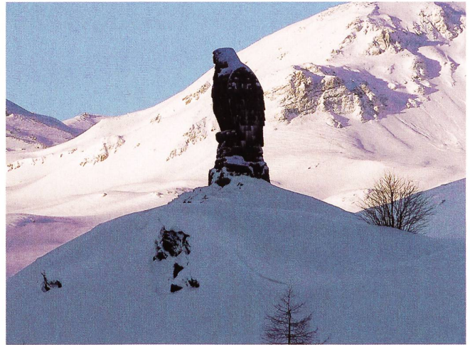
Wer kennt ihn nicht!

dere Stöcke. Mit den Schaufeln graben wir den Schnee um, in den wir geraten sind, nach und nach finden wir alles bis auf einen Ski. Also Lawinensonden auspacken und sondieren mit System, und siehe da, auch diesen «Vermissten» finden wir.