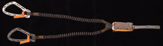
SKYLOTEC Skysafe II