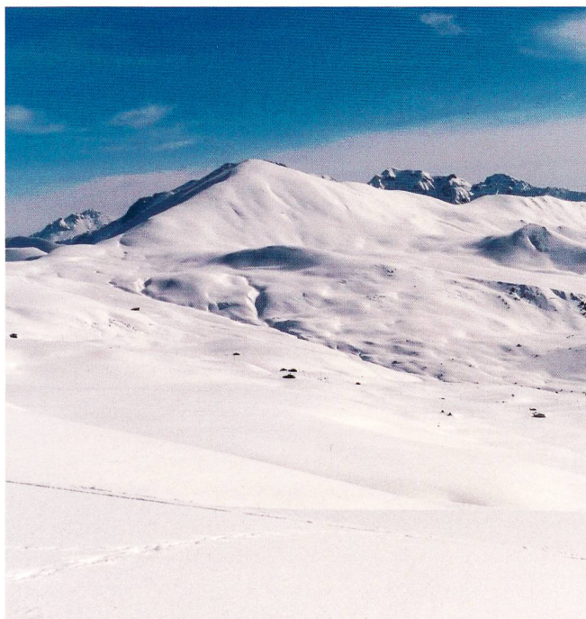
Blick zum Mattijschhorn.

Schneeschuhtour auf das Mattijschhorn; 2461 m vom 23. Februar 2013