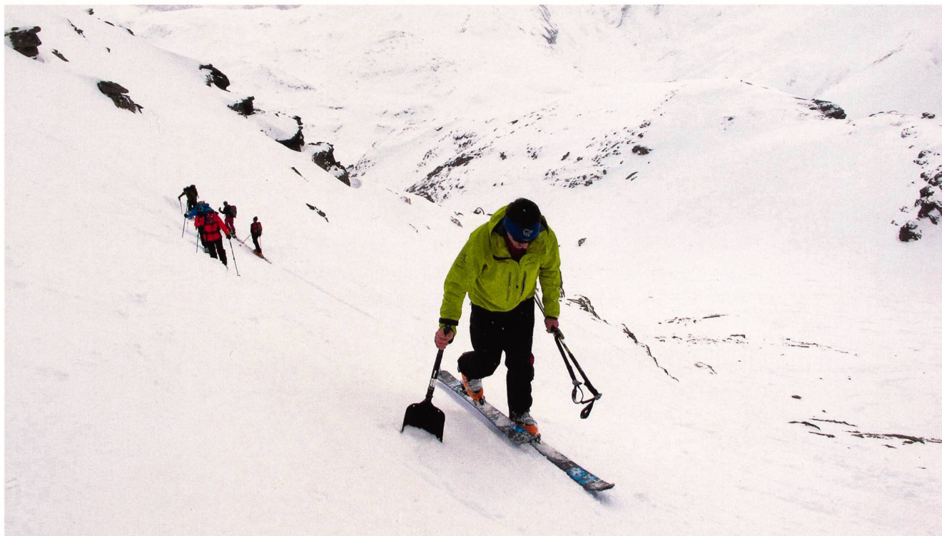
Wenn's hart und steil wird, greifen unsere Begführer zur Schaufel.