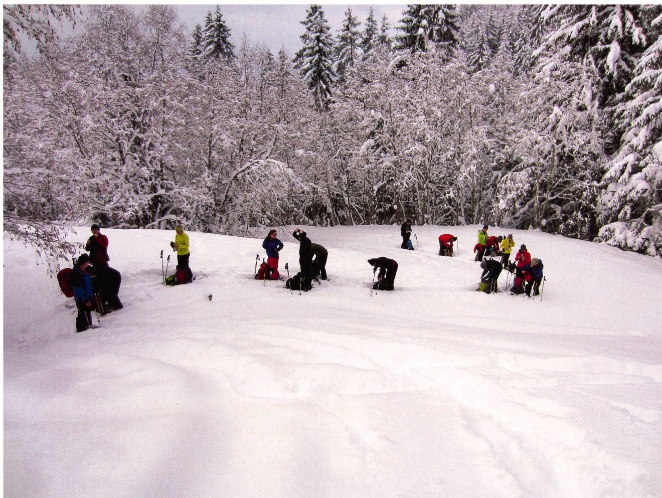
Man bereitet sich vor für einen «Tiefschnee-Aufstieg».

Mittwoch-Skitour Fromattgrat 2170 m vom 13. Februar 2013