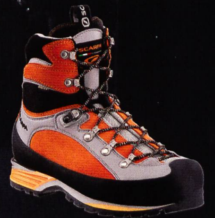
SCARPA Triolet Pro