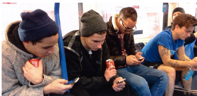
Angeregte, persönliche Kommunikation ...