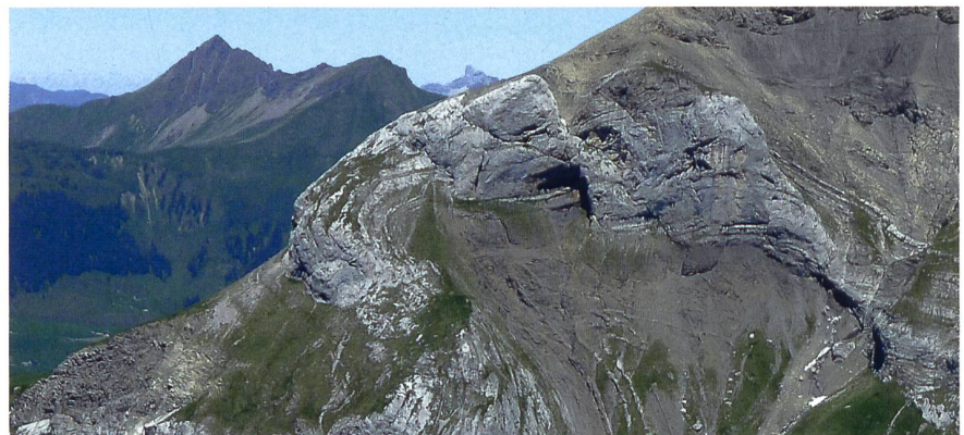
Eindrückliche Gesteinsfalten am Spitzhorn 2807 m über dem Sanetschpass. Warum die Bildung der Alpen trotz solcher Bilder keine einfache «Alpenfaltung» war, illustriert Jürg Meyer in seinem Vortrag.