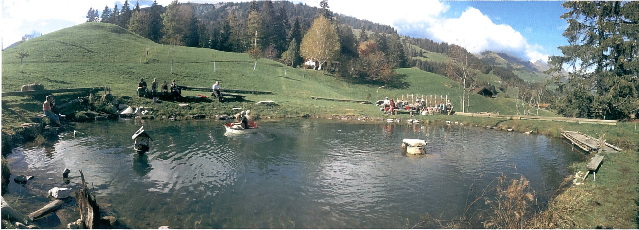
Es ladet der See ...

Ein Singwochenende im Ferienhaus Gibeli (Elsigenalp) vom 25. bis 26. Oktober 2014.