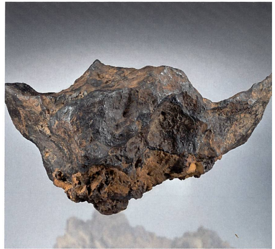
Teilstücke vom Twannberg Eisenmeteorit.

beim Fall vor rund 160 000 Jahren in der Atmosphäre in unzählige Stücke zerrissen worden. Die Bruchstücke des Asteoriden fielen über ein Gebiet noch unbekannter Ausdehnung im Schweizer Jura, nördlich des Bieler Sees im heutigen Kanton Bern. Die Erforschung des Streufeldes ist noch im Gange, aber bereits ist klar: Es ist sehr gross, die Zahl der gefallenen Meteoriten liegt wohl weit über 1000. Das bisherige Fundgebiet erstreckt sich über eine Länge von 5 Kilometern es ist aber möglich, dass sich dieses bis auf 15 Kilometer ausdehnt. Der Twannberg-Meteorit ist der grösste von acht Meteoriten-Funden der Schweiz – und ein sehr seltener Typus Eisenmeteorit. Die