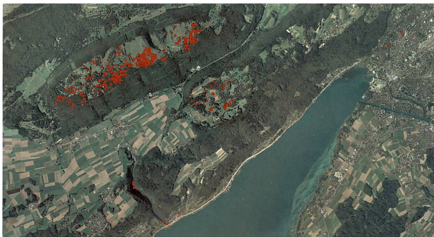
Streufeld © Google Maps.

Sonderausstellung Twannberg-Meteorit – Jäger des verlorenen Schatzes im Naturhistorischen Museum Bern macht die neuen Erkenntnisse der Öffentlichkeit zugänglich und zeigt Einblicke in die spannenden Grabungs- und Forschungsarbeiten. Sie ist auch eine Hommage an die Meteoritenjäger.