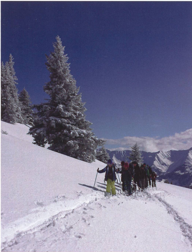
Die FaBe auf Skitour.