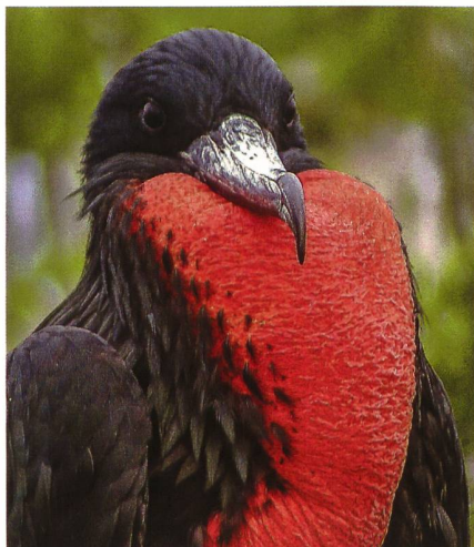
2. Rang: Fred Nydegger, Ich bin der Schönste.

www.sac-bern.ch > Interessengruppen > Fotogruppe