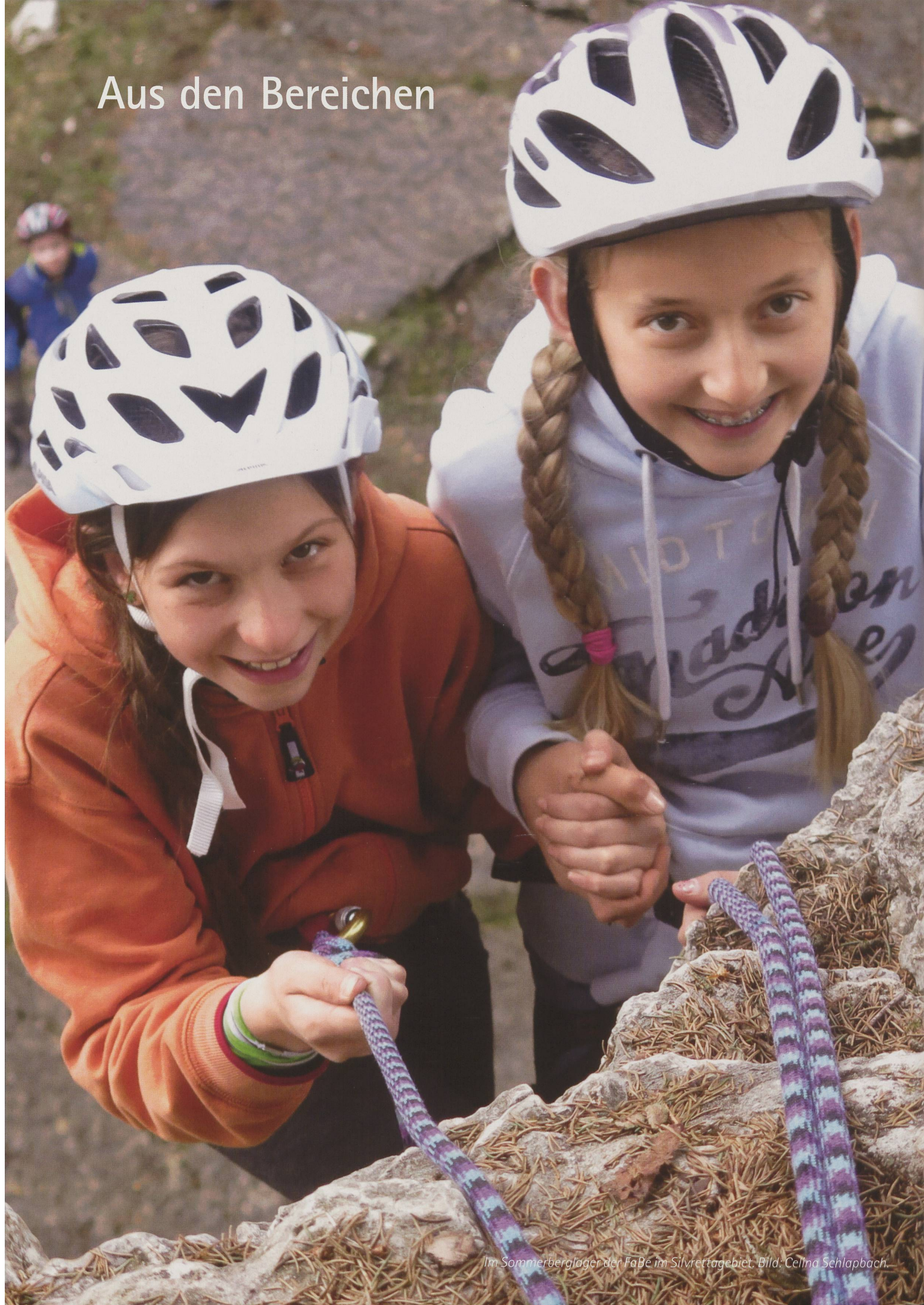
Im Sommerberglager der FaBe im Silvrettagebiet.