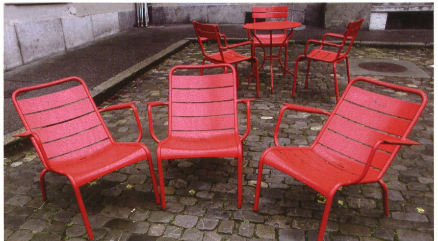
3. Rang: Theres Mejstrik, Platz für eine Auszeit in Rot.