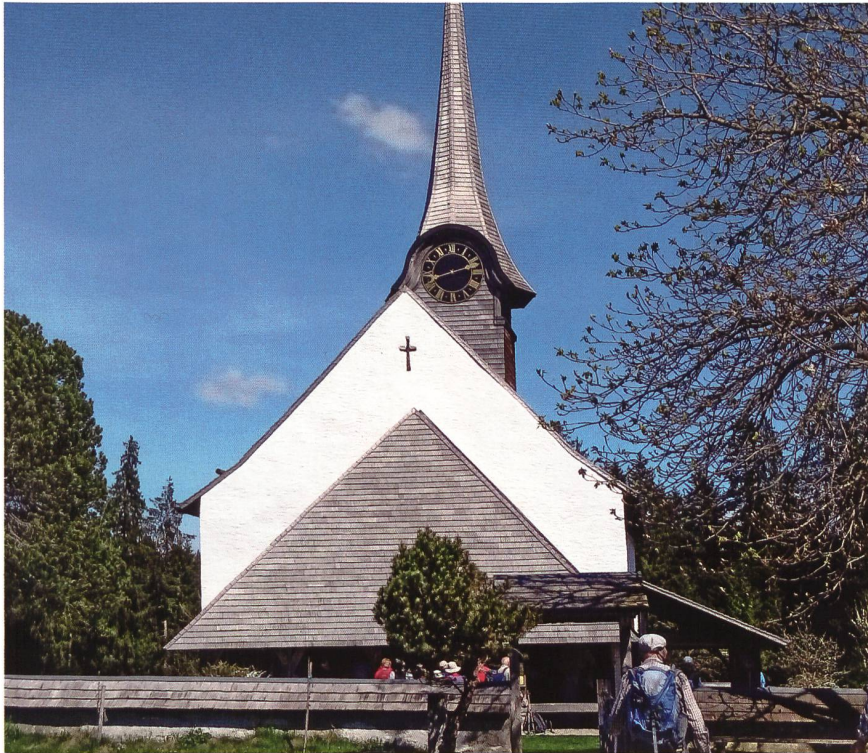
Das Kirchlein Würzbrunnen.

Gründonnerstags-Wanderung der SAC-Veteranen vom 13. April. 2017.