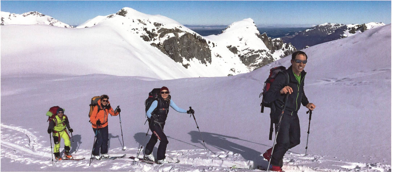
Der letzte Teil des Aufstiegs führt an die Sonne – der Pulverschnee verspricht eine tolle Abfahrt.

Skitour der JO (nicht ganz) aufs Ärmighore und aufs Sattelhore gleich daneben, 18. Februar 2017.