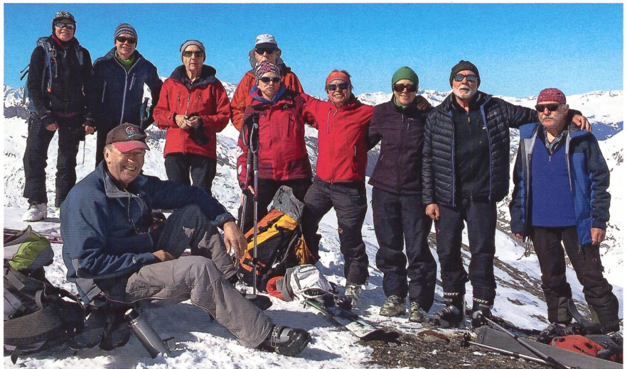
Zufriedene Teilnehmer der Skitourenwoche im Safiental, trotz wenig Schnee.

Ich glaubs ja nid: So wenig Schnee! Aber die Gruppe schätzte vor dem Aufbruch trotzdem jeweils die Lawinensituation, die Verwehungen und die Nordhänge mussten im Auge behalten werden. Wir haben uns einmal beim Aufstieg schon gewundert und auch etwas gesorgt, verlief doch eine Spur direkt in den Lawinenkegel und hinten wieder hinaus! Letztendlich fanden wir immer genug Schnee. Manchmal mussten wir halt um die Alpenrosen herumlaufen, aber es war wunderbarer Pulverschnee, später dann Sulz und kaum Harsch. Und ich glaubs ja nid: Vis-à-vis der Hütte,