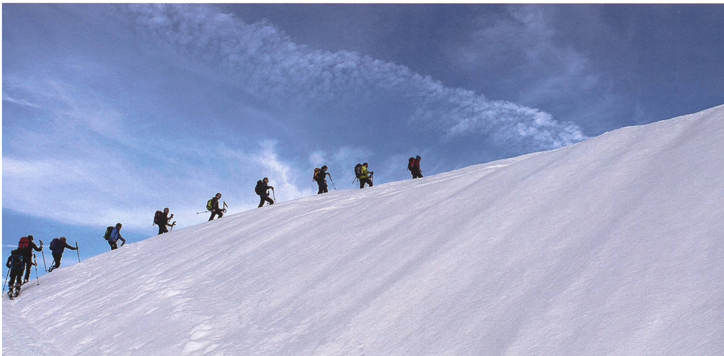
Der perfekte Tag bleibt lange in Erinnerung.