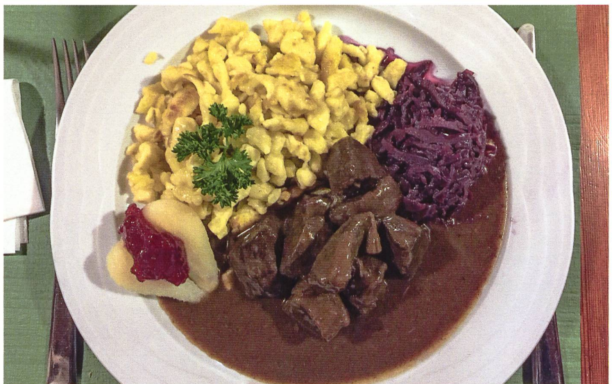
Kulinarische Krönung der Woche: Einheimisches Hirschragout.

wo kein Schnee mehr liegt, auf der wildtiergeschützten Flanke aufs Bruschgorn, das man nicht begehen aber ansehen darf, sehen wir zwei Rudel von rund zwanzig Steinböcken und Steingeissen mit den Jungtieren. So schön!