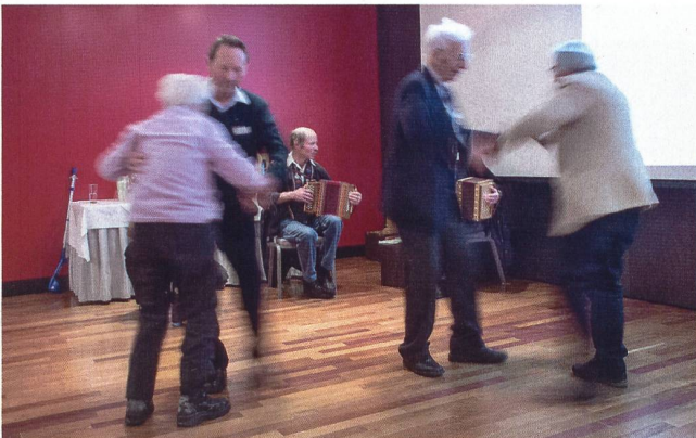
Gelernt ist gelernt: Dynamischer Tanz der Ältesten.