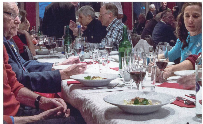
Älplermagronen mit viel Zwiebeln runden den schönen Abend ab.