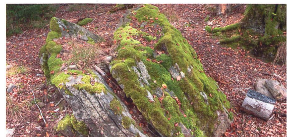
Echtes Gipfel Feeling dank Findling auf Punkt 760.