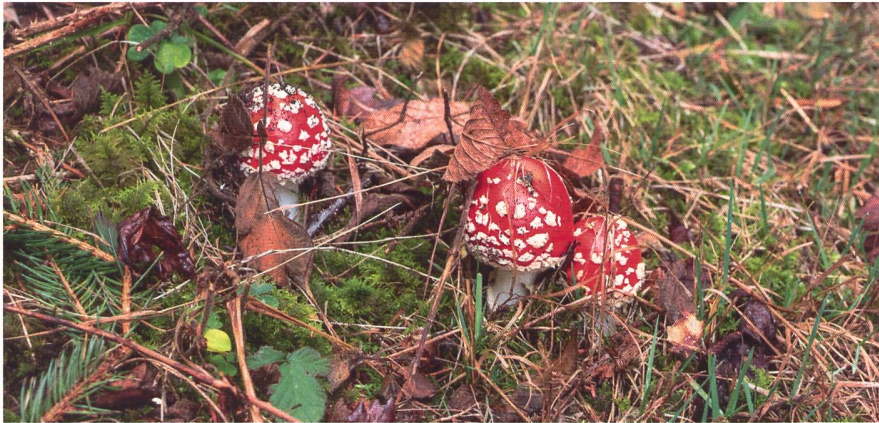
Schmuckhaft und schmackhaft, den Unterschied sollte man beim Pilzesammeln kennen.

Grauholz setzt man gleich mit Autobahn, Raststätte und Tunnel. Namensgeber dieser Synonyme schneller Mobilität ist das ausgedehnte Waldgebiet östlich der Autobahn.