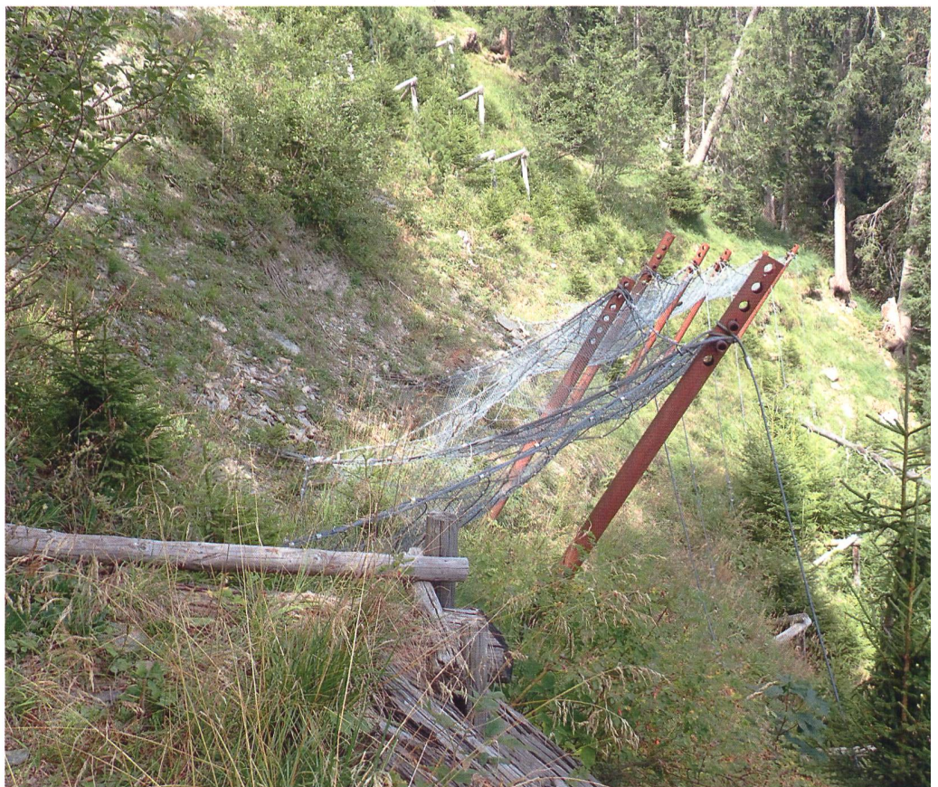
Im Vordergrund eines der neueren Schneenetze und im Hintergrund die sogenannten Ogiböcke aus Kastanienholz. Diese schützen Jungwuchs vor abrutschenden Schneemassen.