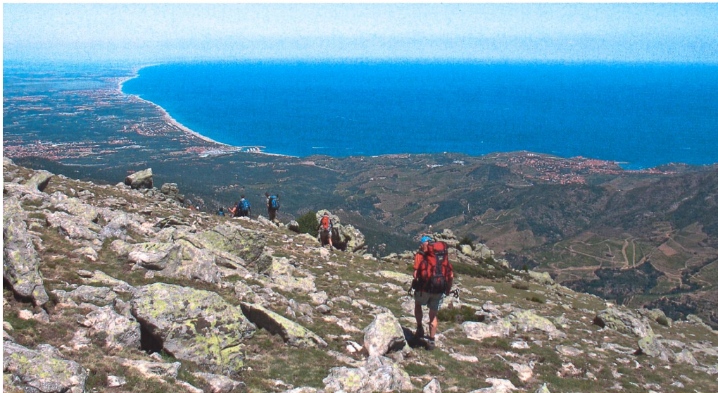
Abstieg ans Mittelmeer am letzten Wandertag.