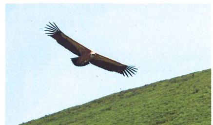
Ein Gänsegeier kreist über den Wanderern.