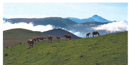
Pferdeherde im Baskenland.