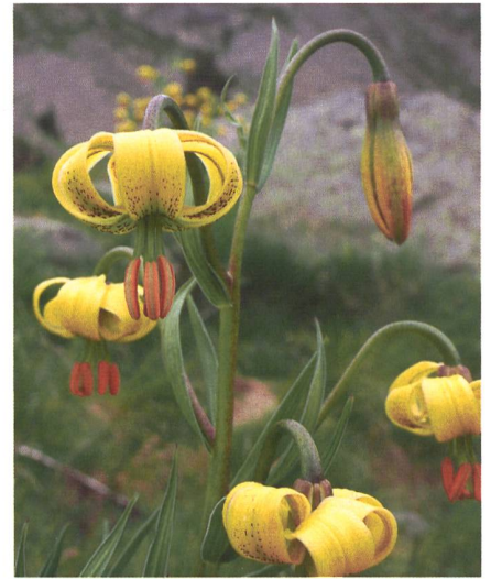
Pyrenäen-Lilien, eine der vielen endemischen Pflanzen in den Pyrenäen.

Am Anfang waren es anstrengende Unterfangen. Die Leiter orientierten sich an ihrer eigenen Pioniertour, als sie mit bis zu 25 Kilogramm schweren Rucksäcken, mit