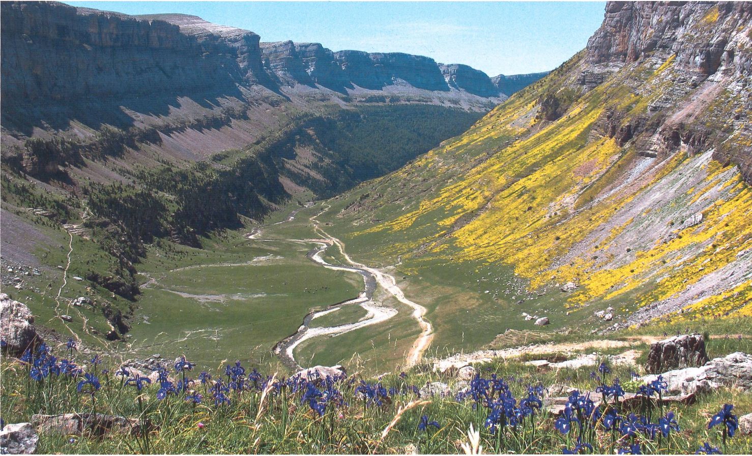
Im Abstieg in den Ordesa-Cañion.