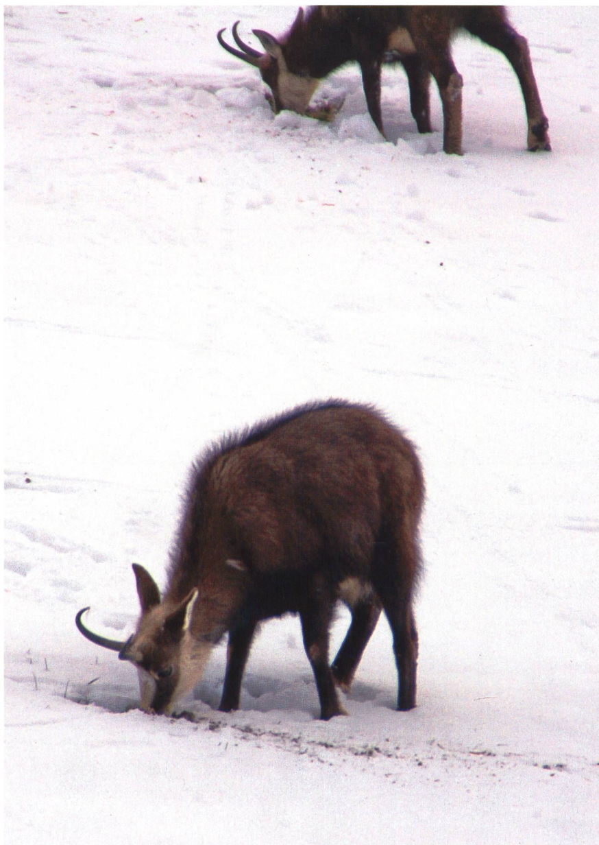
Gämsen scharren sich Futter frei.

Neuschnee nicht wohlfehlte und Richtung Bau kehrt machte. Zehn Gehminuten vor dem Gipfel der Wasenegg machen auch wir kehrt, da der mittlerweile wieder bedeckte Himmel die Sicht stark getrübt hat und nach der Lawinenprognose in Gratnähe besondere Vorsicht geboten ist. Auf der Abfahrt durchs Schilttal nach Gimmeln profitieren wir vom leichten Neuschnee und sehen, wie die Gämsen auf von Schneerutschen freigelegten Flächen nach Futter suchen.