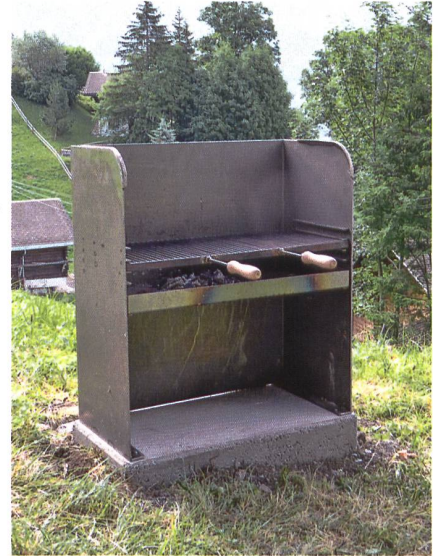
Der neue Grill funktioniert einwandfrei, wie die Hüttenwerker beim Testen erleben durften.