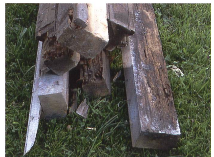
Der Zahn der Zeit hat an diesen Bodenbalken genagt.