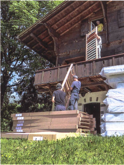
Dank des Teamworks der Hüttenwerker wandern Lattenroste und Matratzen fix zwei Stockwerke höher.

In der Zeit vom 25.–28. Juni und vom 2.–4. Juli fanden zwei Arbeitseinsätze im Chalet Teufi mit je zwei bis vier Teilnehmern statt. Dabei wurde der Boden im Schlafraum im Erdgeschoss erneuert und wurden im ganzen Haus die Betten ersetzt.