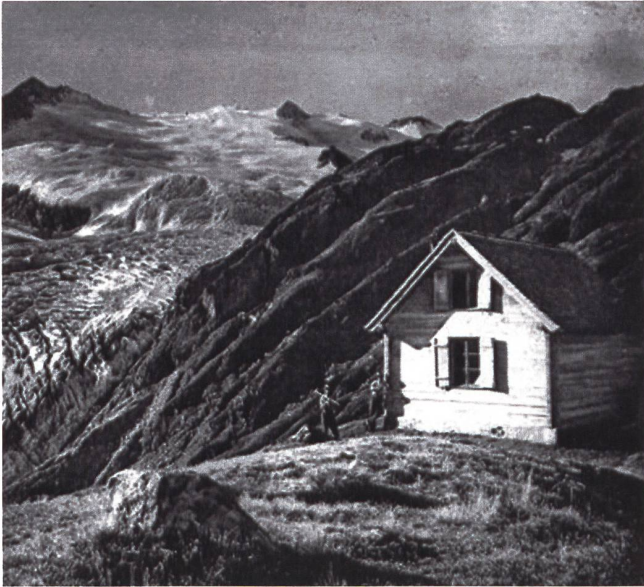
Die Gaulihütte 1895 (SAC-Jahrbuch 1895 Seite 120:).