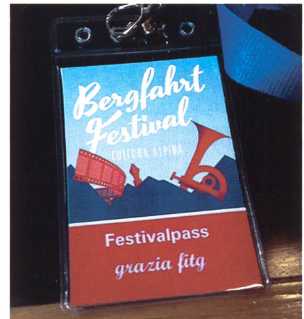
Die nächste Bergfahrt findet 2020 statt.