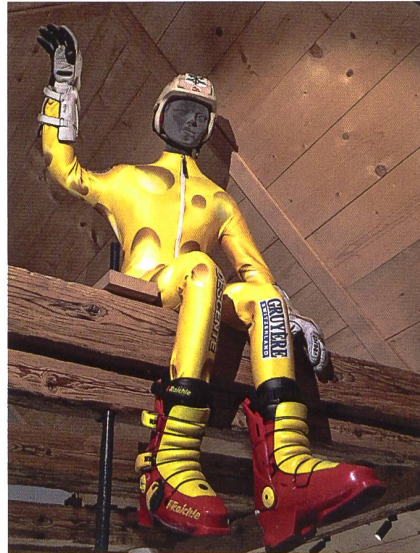
Der legendäre Käsedress der Schweizer Skirennfahrer aus den Jahren 1992–1998.