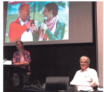
Pecha Kucha: Anzahl Präsentationsfolien und Redezeit je Folie sind kurz und vorgegeben.