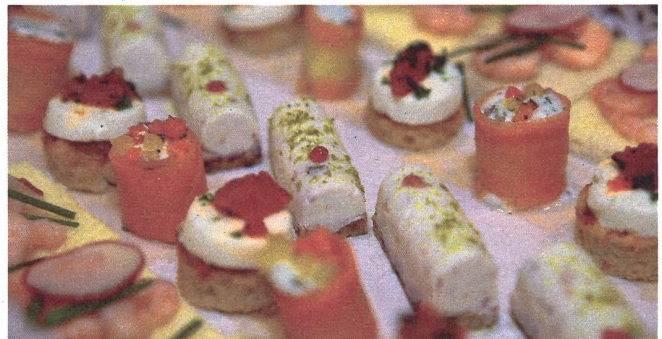
Sommer-Apéro im Anschluss an die Sektionsversammlung.

Der Vorstand der Sektion lädt herzlich zum fröhlichen Apéro ein. In lockerem Ambiente besteht die Gelegenheit, sich mit dem Vorstand und den anderen Sektionsmitgliedern über das Clubleben oder deine Bergerlebnisse auszutauschen. Eine Anmeldung dazu ist nicht erforderlich.