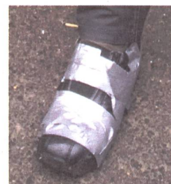
Auch die Schuhe scheinen in die Jahre gekommen zu sein.