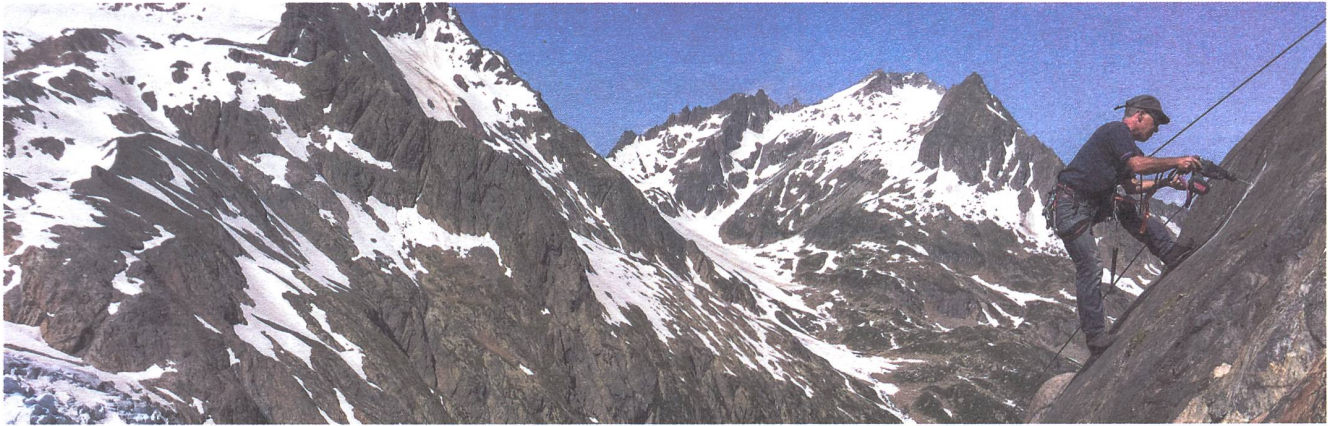
Turi am Routen bohren.

In den vergangenen Jahren sind rund um die Trifthütte alpine Kletterrouten in verschiedenen Schwierigkeitsgraden eröffnet worden. Bislang fehlte jedoch ein gut abgesicherter Klettergarten für Kinder und Klettereinsteiger. Genau dies konnte nun dank der grosszügigen Jubilarenspenden realisiert werden.