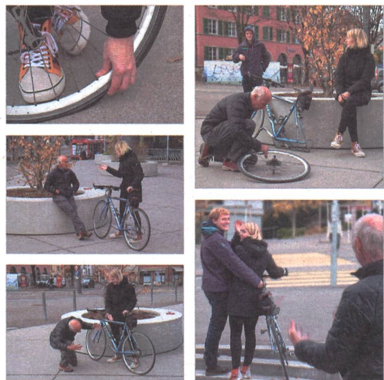
Mit dem Beitrag So nã Frächheit erzielte die Fotogruppe an der Photo Münsingen den sehr guten 13. Platz.