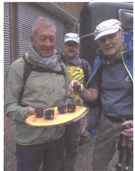
Verpflegungsposten à la Veteranen.