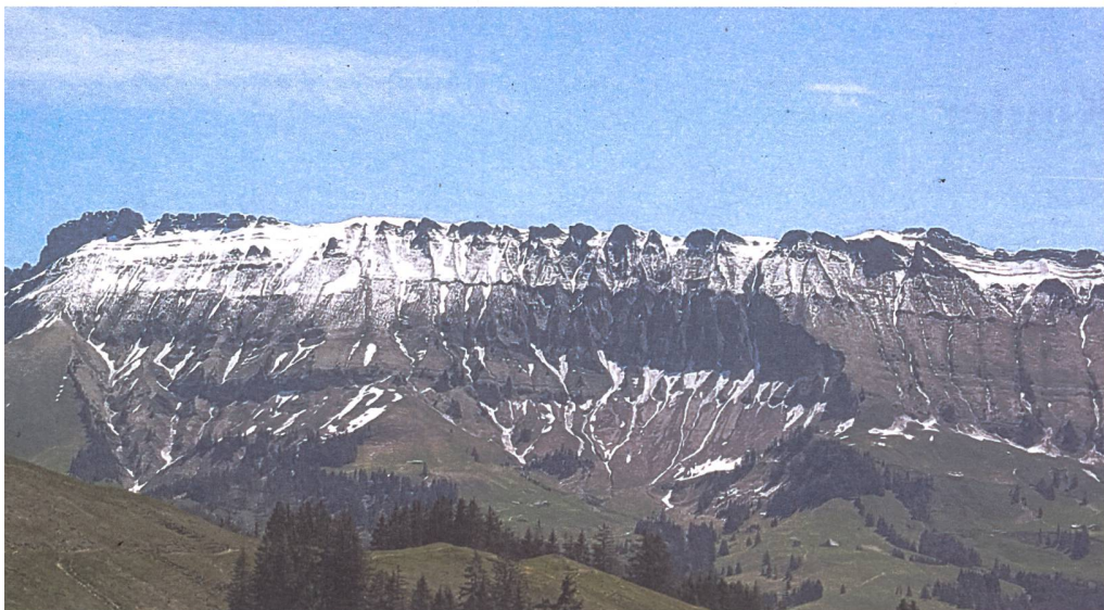
Verschneite Voralpen – und das Mitte Mai!