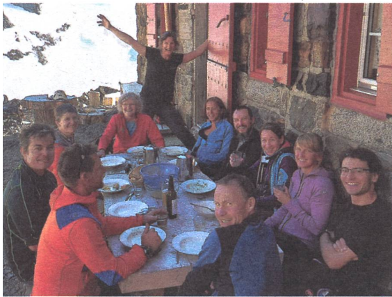
Draussen Essen – Tourenleiter sind nun mal Naturkinder!

Bis am 26. Juli 2019 müssen alle Tourenleiter ihre Touren für das Tourenjahr 2020 eingegeben haben. Wer noch Ideen sammeln wollte, konnte anlässlich des Reko-Weekends im Triftgebiet noch neue Tourenmöglichkeiten auskundschaften. Elf Tourenleiter nutzten diese Gelegenheit an diesem Wochenende, obschon auch in den Bergen hohe Tem-