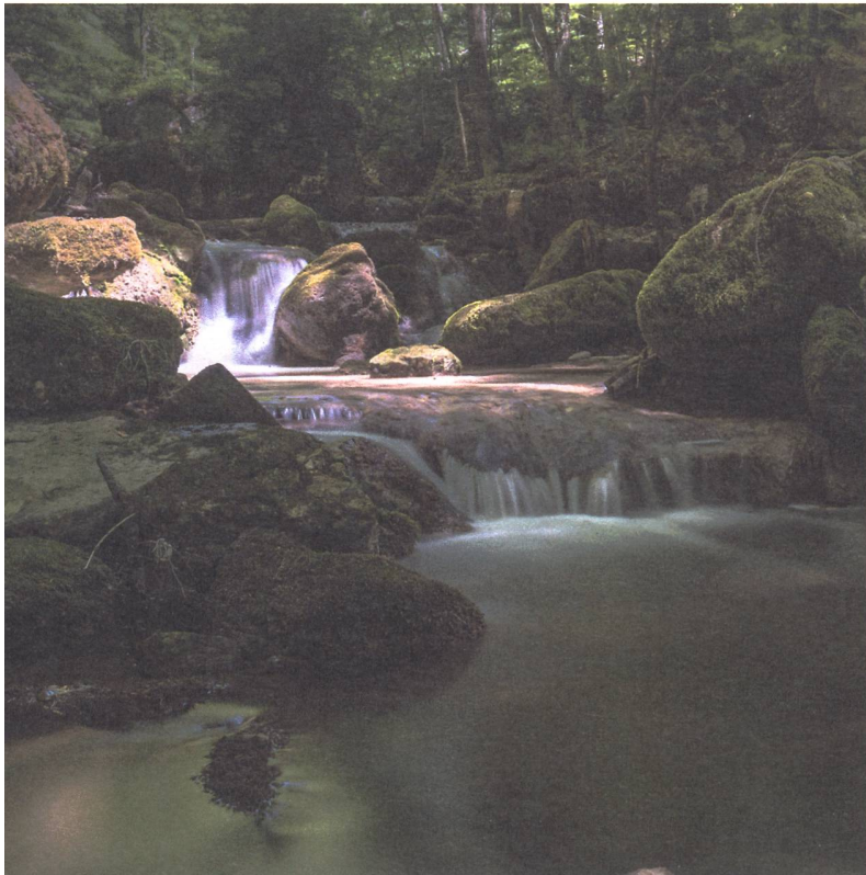
Weiches Wasser in der Twannbachschlucht.