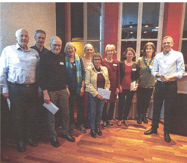
25-Jahre-Jubilaren mit Vizepräsidentin und Präsident.