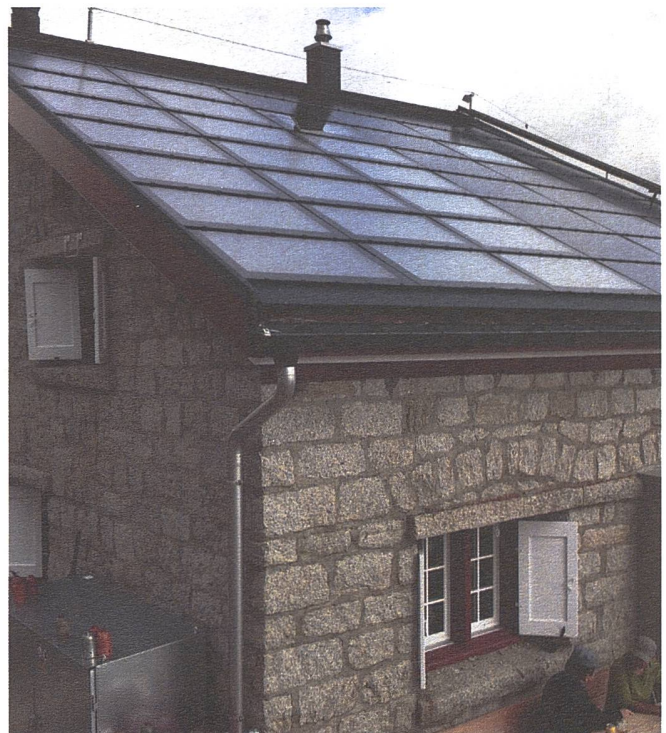
Ansicht Systemdach Albert Heim-Hütte.