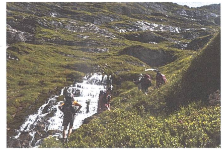
Bestes Training: Mit viel Gewicht im Rucksack hoch in die Gspaltenhornhütte.