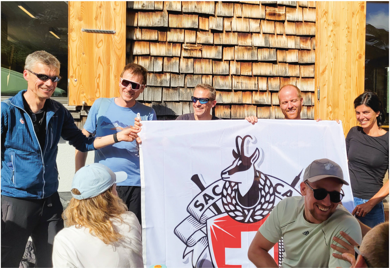
Feierlich-fröhliche Fahnenübergabe.