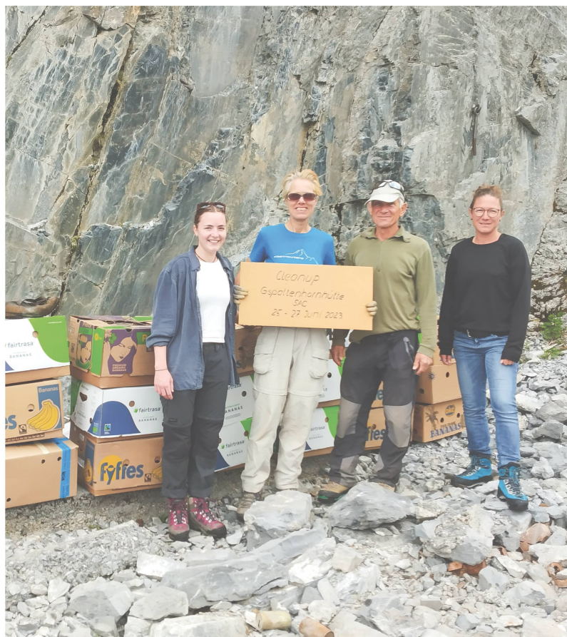
Cleanup-Team ohne Hüttenwart – er steht hinter der Kamera ...

Ulrike Michels, Stv. Ressort Umwelt