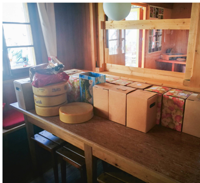
So viel Käse und selbst gemachter Sirup wurde bei der Wanderung von der Alp Gamchi in die Gspaltenhornhütte getragen.