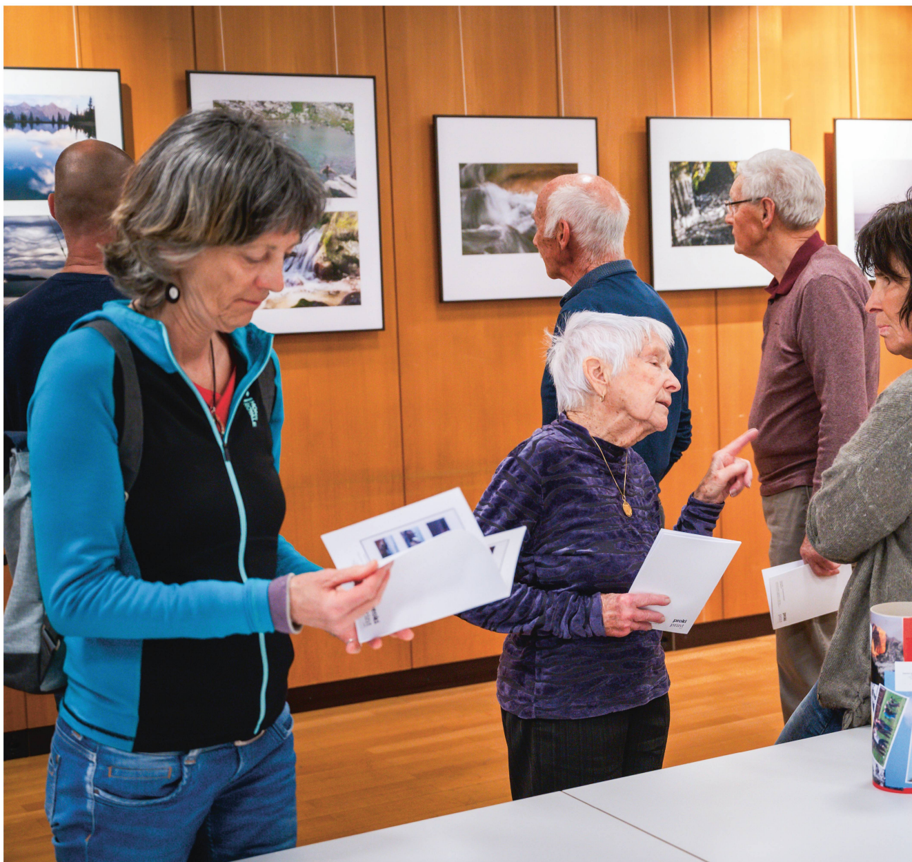
Gäste im angeregten Gespräch.