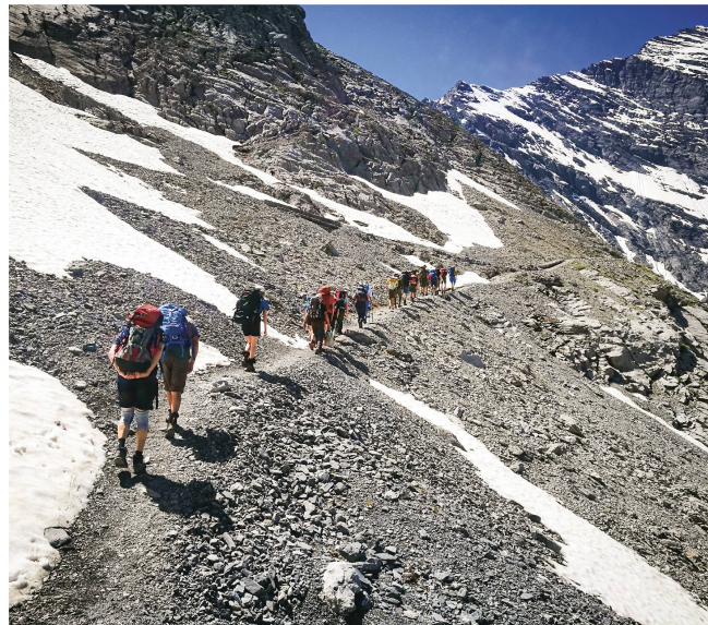
Lasten auf dem Rücken statt im Helikopter-Materialnetz.