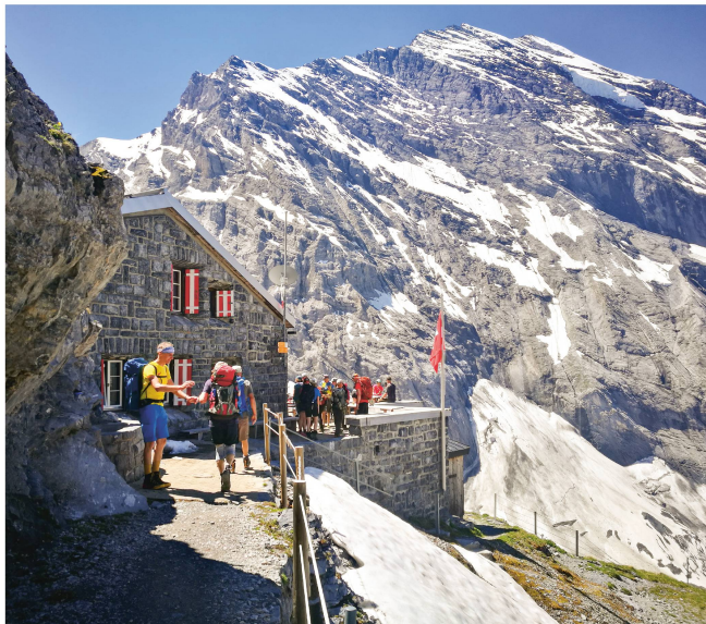
Begrüßung bei der Ankunft an der Hütte.