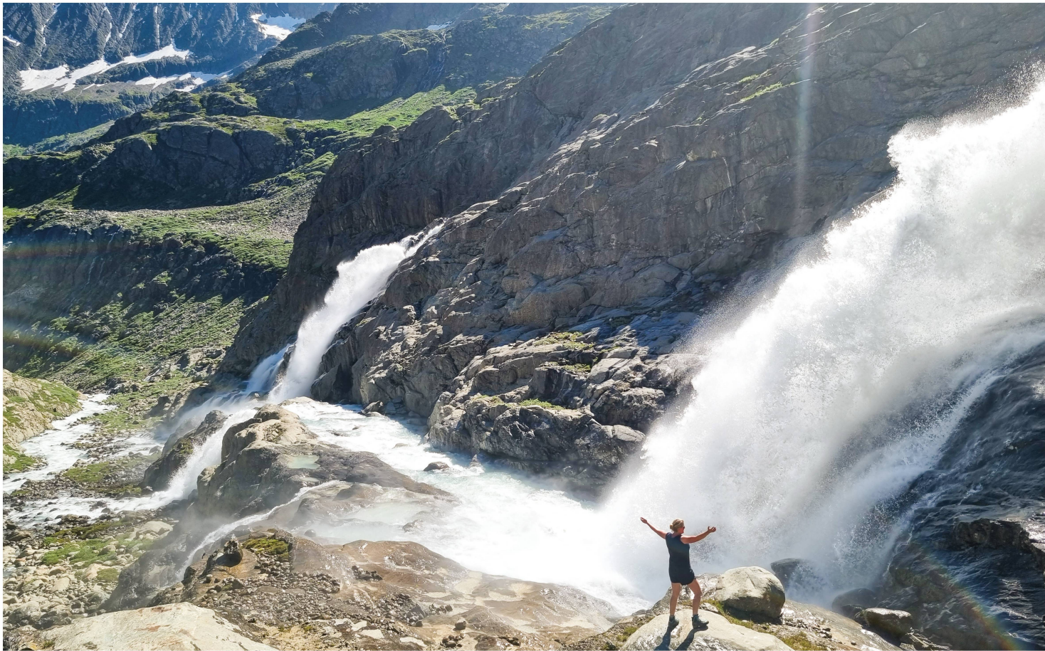
Was für ein Wasserfall!