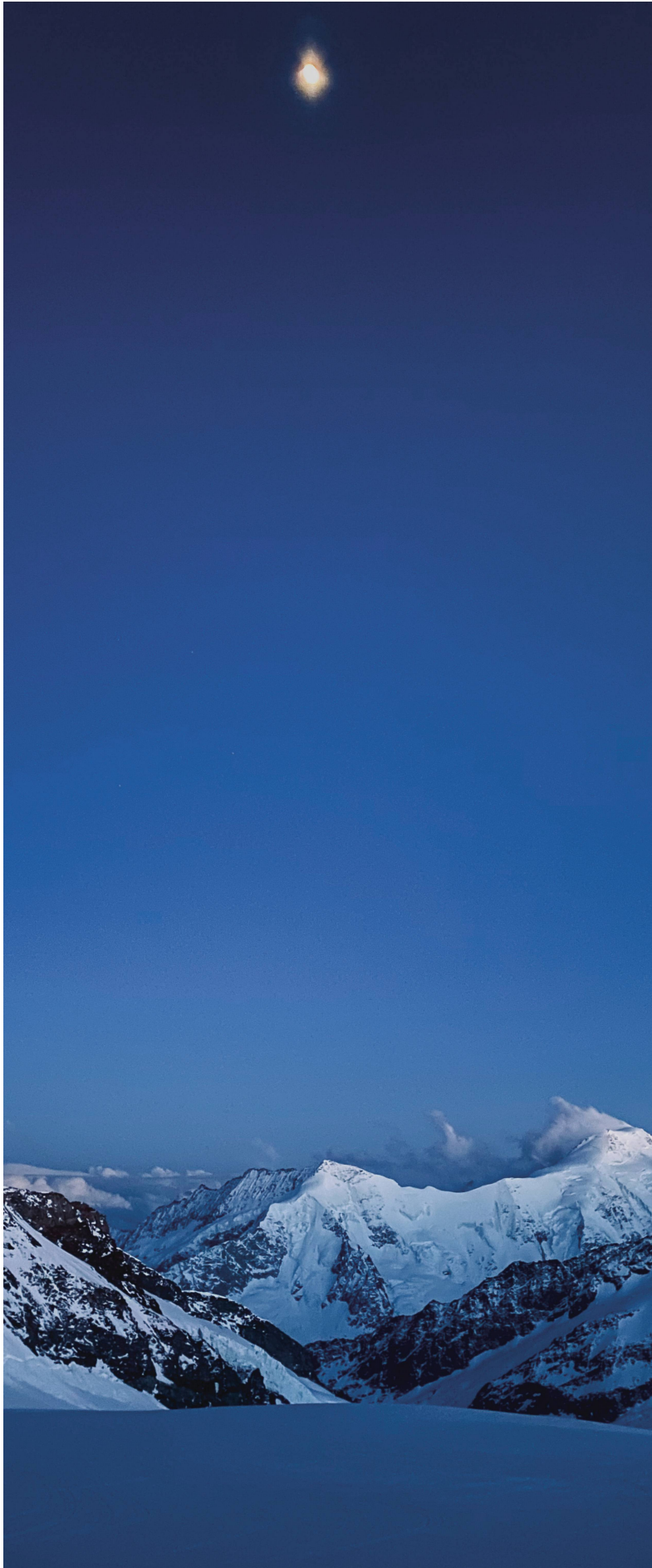
Mondlicht an der Mönchsjoehütte.