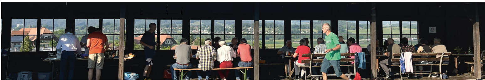
Genuss mit Ausblick.