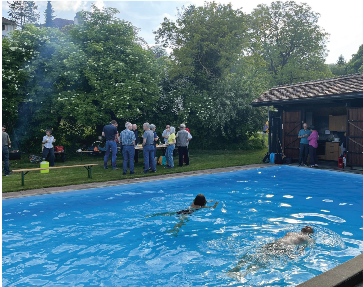
Apéro, Gedankenaustausch sowie baden am Anfang.