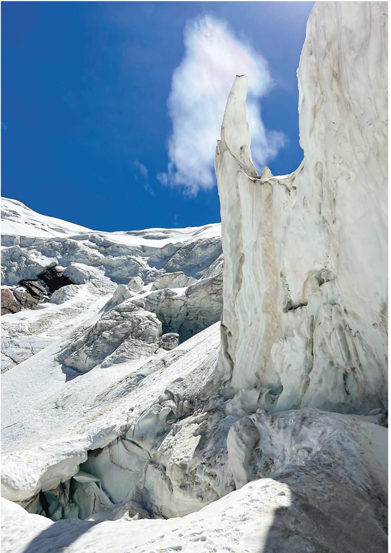
Eisformationen auf dem Weg zum Weissmies. Den Tourenbericht zum Bild findest du auf der Webseite.