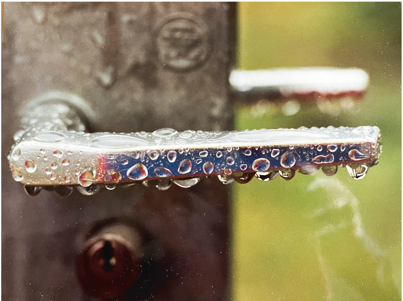
Ein exzellentes Auge bewies Hanni Gränicher mit diesen beiden Fotos, mit denen sie zwei Mal den Fotowettbewerb der Fotogruppe gewann.