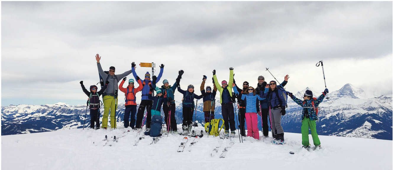
Geschafft – wir machen das Gipfelfoto!