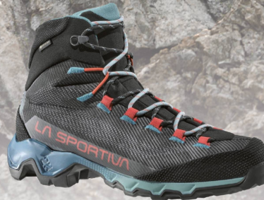
La Sportiva Aequilibrium Hike Women GTX CHF 219.00