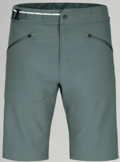
Ortovox Brenta Shorts M CHF 120.00