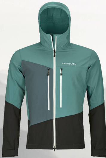
Ortovox Westalpen Softshell Jacket M CHF 344.00