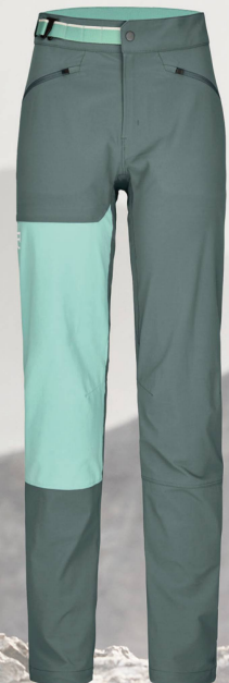
Ortovox Brenta Pants W CHF 144.00