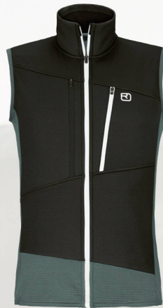
Ortovox Fleece Grid Vest M CHF 152.00