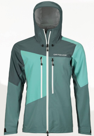
Ortovox Westalpen 3L Jacket W CHF 528.00