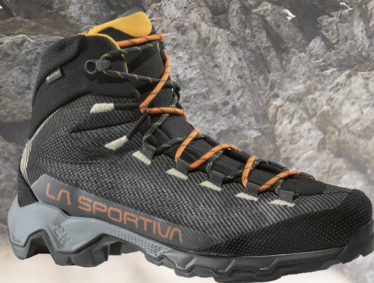
La Sportiva Aequilibrium Hike GTX CHF 219.00