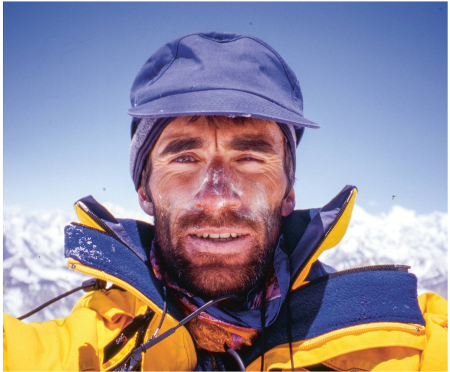
Selfie Loretan.

Von Leseпаusen im Basislager in die Todeszone am Achttausender: Am Samstag eröffnet im Raum Biwak die neue Ausstellung «Am Limit. Auf Expedition mit Erhard Loretan». Die Ausstellung gibt erstmals Einblick in die Originaltagebücher und Filmaufnahmen des Freiburger Ausnahmebergsteigers Erhard Loretan (1959–2011). «Am Limit» lässt uns seine physischen und mentalen Herausforderungen am Berg miterleben und fragt auch uns nach den Möglichkeiten und Grenzen unserer Leistungsbereitschaft. An der interaktiven Station sind Sie an der Reihe: Ob Nanga Pabat, Trango Tower oder K2 – wählen Sie einen Gipfel aus und erfahren Sie spannende Details zu Loretans Expeditionen. Sie sind doch eher Typ Disco? Vor dem Zelt wartet Loretans Walkman: für ein Ohr voll Hits seiner Zeit.