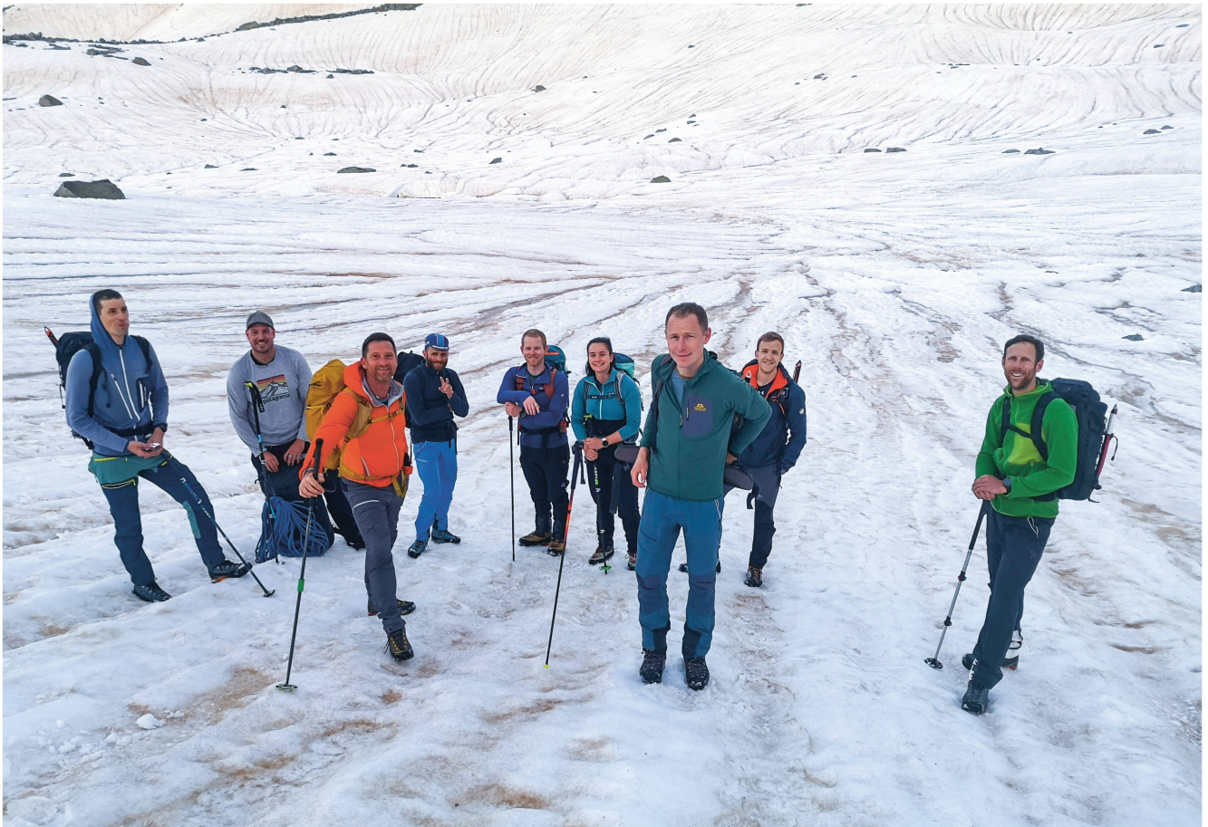
Trotz mittelpächtiger Bedingungen topmotivierte Aspis.