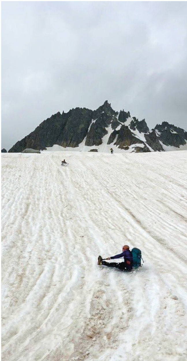
Neue olympische Disziplin Firnrutschen.

Eigenfrequenz und scheidete bei ca. 85,4 km/h. Wir bahnten uns also erst den Weg durch die schlängelförmig das Zuhause suchenden Nachtschwärmer durch Bern und radelten frühmorgens zielstrebig bei tropischen Temperaturen zum Treffpunkt am Thunplatz, um Petrus ein Schnippchen zu schlagen und noch vor dem Ausbruch der schleusenartigen Niederschläge wieder zurück auf dem Furkapass im Bus zu sitzen. Bereits verschwitzt ging es um 3 Uhr los Richtung Grimsel, runter nach Gletsch, hoch zum Furkapass. Dank einer Baustelle bei Iseltwald bekamen wir völlig überraschend noch das andere Seeufer zu Gesicht. Angekommen auf dem Furkapass starteten wir 5.30 Uhr Richtung Galenstock SE-Sporn. Der Weg war trotz des noch vielen Schnees schnell gefunden und trug uns entgegen der Erwartung von Pfloterschnee gut zum Einstieg am Sporn. Der bröselige Einstieg war schnell überwunden und es eröffnete sich bald eine wunderbare Gneis-Chraxelei – ein Genuss. Oben am Spornausstieg angekommen, überraschten uns Artgenossen mit Brettern an den Füßen den Berg hoch schlurfend – Ende Juni sieht man diese Fortbewegungsart doch eher selten. Im mittlerweile