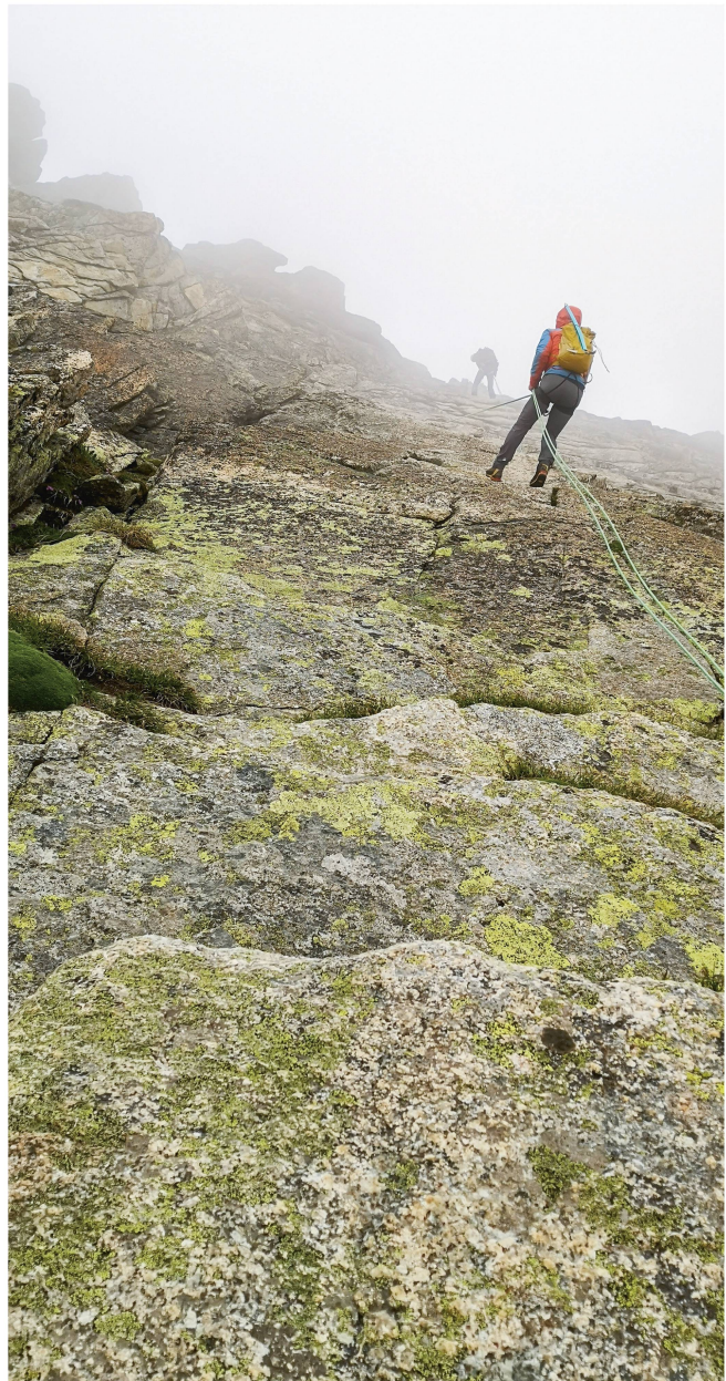
Gut organisiert brachten wir das Abseilen rasch hinter uns.

Eigenfrequenz und scheidete bei ca. 85,4 km/h. Wir bahnten uns also erst den Weg durch die schlängelförmig das Zuhause suchenden Nachtschwärmer durch Bern und radelten frühmorgens zielstrebig bei tropischen Temperaturen zum Treffpunkt am Thunplatz, um Petrus ein Schnippchen zu schlagen und noch vor dem Ausbruch der schleusenartigen Niederschläge wieder zurück auf dem Furkapass im Bus zu sitzen. Bereits verschwitzt ging es um 3 Uhr los Richtung Grimsel, runter nach Gletsch, hoch zum Furkapass. Dank einer Baustelle bei Iseltwald bekamen wir völlig überraschend noch das andere Seeufer zu Gesicht. Angekommen auf dem Furkapass starteten wir 5.30 Uhr Richtung Galenstock SE-Sporn. Der Weg war trotz des noch vielen Schnees schnell gefunden und trug uns entgegen der Erwartung von Pfloterschnee gut zum Einstieg am Sporn. Der bröselige Einstieg war schnell überwunden und es eröffnete sich bald eine wunderbare Gneis-Chraxelei – ein Genuss. Oben am Spornausstieg angekommen, überraschten uns Artgenossen mit Brettern an den Füßen den Berg hoch schlurfend – Ende Juni sieht man diese Fortbewegungsart doch eher selten. Im mittlerweile