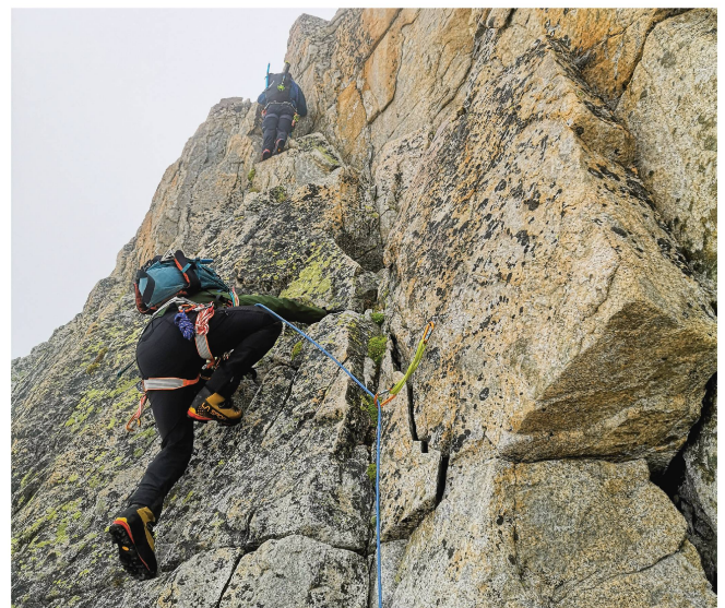
Schöne Gneis-Kraxelei am Galenstock SE-Sporn.

Aber der Reihe nach. Im Verlauf der Woche vor der Tour kam eine nahezu unlösbare Aufgabe auf die Tourenleiter-Aspis zu – eine vollumfängliche Tourenplanung soll für das Weissmiesgebiet erarbeitet und abgegeben werden. Bei MeteoSchweiz und Estofex waren Gewitter, stürmischer Höhenwind, Starkregen und eine überaus hohe Nullgradgrenze angesagt und die Böden waren schön «plüttergefüllt». Was tun? Einer hatte die Antwort: Eintagestour am Galenstock und bot auch gleich ein Fahrgerät auf ordnungsgemässen vier Rädern – einzig das Chassis hatte eine unvorteilhafte