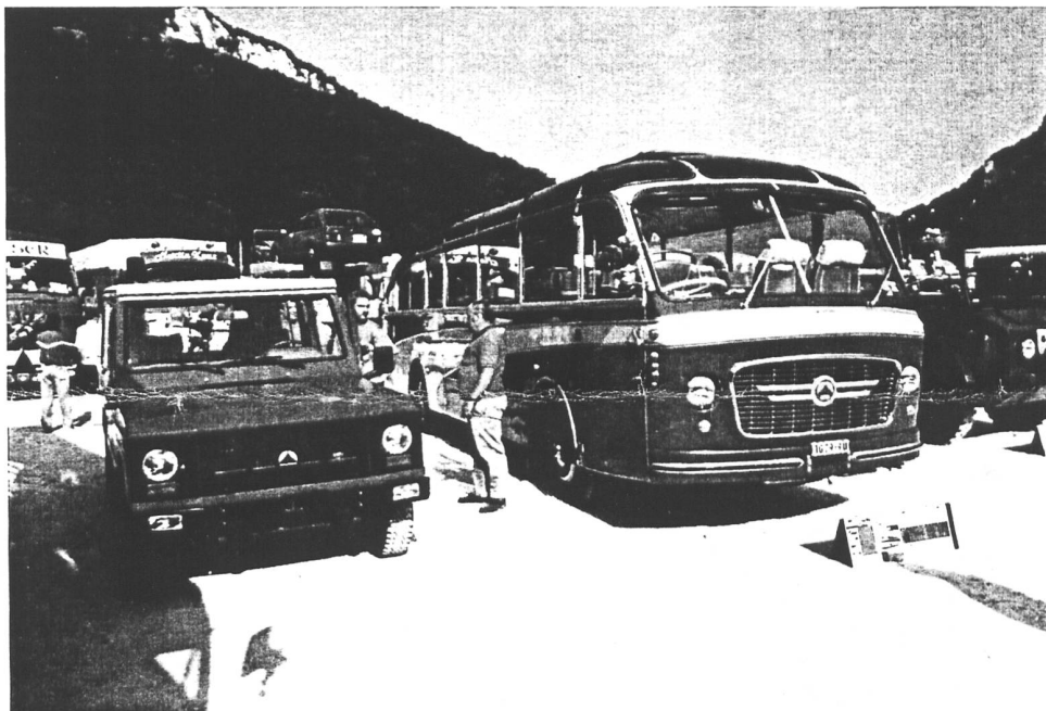
Saurer V2H, Jeep