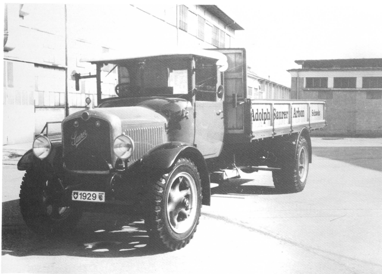
Saurer 5ADD Jahrgang 1929

Es gibt sehr wenige Vereine, die sich um den Erhalt von technischem Kulturgut kümmern, wir zeigen vollen Einsatz!