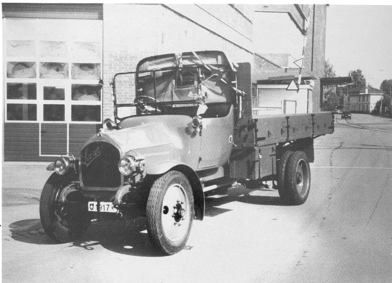
Saurer 3TC, Jahrgang 1917