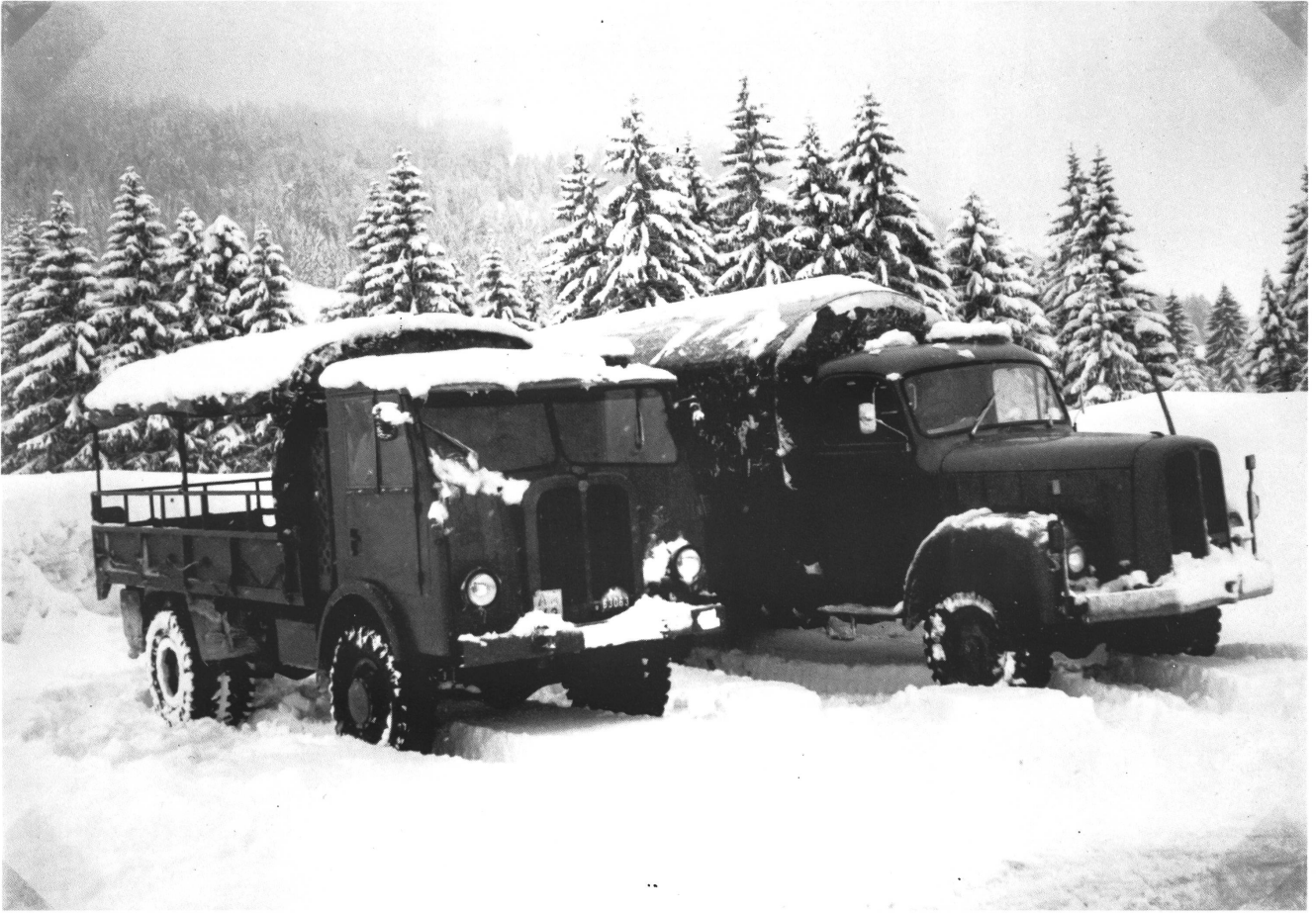
Wiederholungskurs 1982. Saure Vierlivier Bauj. 52 und Saure ZDM 1965 beim Steildöchein auf der Schwägalp.