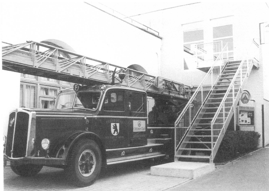
Bild: Neuer Zugang mit N4C Feuerwehrdrehleiter.

Auch 1997 erfreuten sich verschiedene Besucher aus dem Ausland und der Schweiz an unseren Exponaten im Museum. Die Gruppe mit dem längsten Anfahrweg kam aus Sandvik einer Stadt 200 km nördlich von Stockholm!