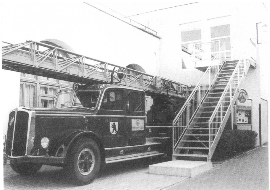
Bild: Neuer Zugang mit N4C Feuerwehrdrehleiter.

Auch 1997 erfreuten sich verschiedene Besucher aus dem Ausland und der Schweiz an unseren Exponaten im Museum. Die Gruppe mit dem längsten Anfahrweg kam aus Sandvik einer Stadt 200 km nördlich von Stockholm!