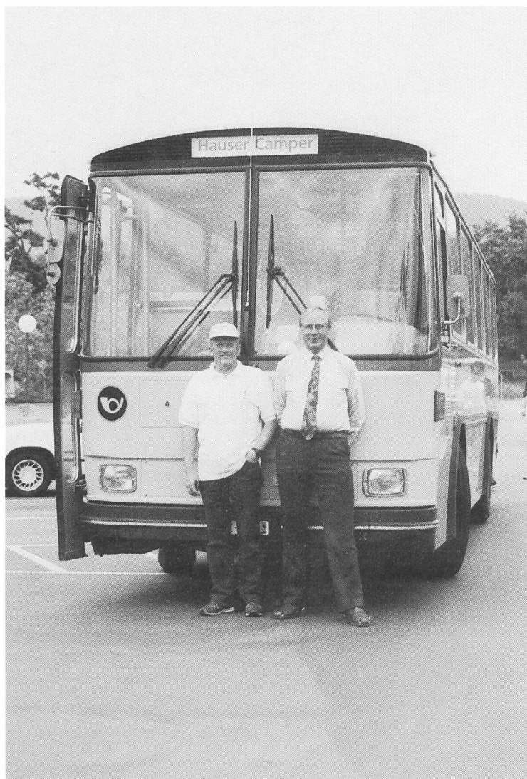
Der neue und der alte Besitzer auf einem Parkplatz in California