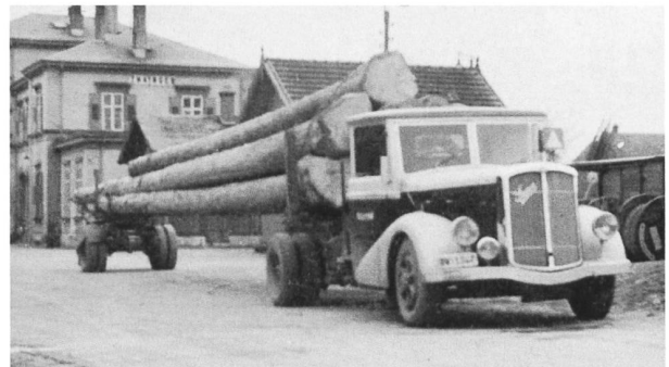
vor dem Bahnhof Thayngen

Anfangs der 60er Jahre wurde Rundholz zum Teil Mangelware. Mein Vater musste es aus dem Schwarzwald beschaffen. Den Transport übernahm die Fa. Dillier aus Sarnen mit ihrem Saurer, welcher mit einem wechselbaren Drehschemelaufbau ausge- rüstet war. Es waren harte Einsätze für den Wepfer, bei den damaligen Strassenverhältnissen und sol- chen Distanzen auf dem Blechsitz seine Arbeit ver- richten zu müssen.