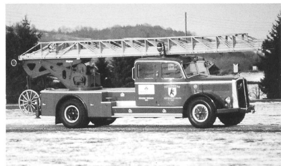
Feuerwehrdrehleiter Saurer N4C