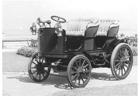
Saurer Doppelphaeton 1898

Es ist wieder soweit. Nach 12 Jahren gibt es wieder einen Anlass, um mit dem Saurer nach Arbon zu kommen. Am 1. Mai 2010 wird das neue Museum eröffnet. Die Gemeinde Arbon hat mit viel Freude wieder die Schlosswiese direkt am See für ein grosses Saurer und Berna Treffen freigegeben. Zur gleichen Zeit findet in Arbon die Arbon Classics statt. Auch an Pw-Oldtimern, Dampfzügen, alten Schiffen und Traktoren wird es nicht mangeln.