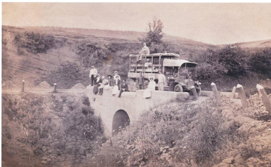
Saurer 3TC Jahrgang 1911, irgendwo in Russland