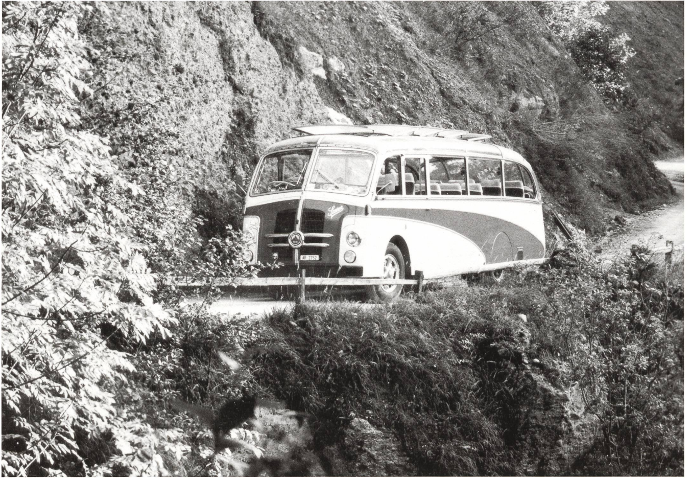
Ottocar Saurer 1951

Otto Brander Chapfenbühlweg 4 CH-9100 Herisau tel. 071 / 51 30 75