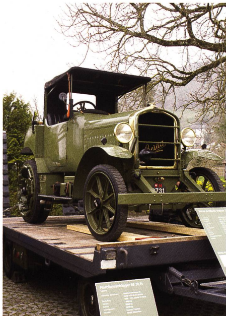
Berna Artillerie Traktor 1932

«Scho e Wili» hät's bruucht! Jedoch pünktlich nach Marschtabelle erreichten die 36 historischen Fahrzeuge Stein am Rhein.