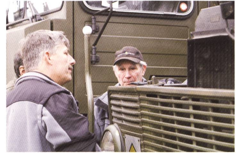
Profis unter sich

Ein wiederum erfolgreicher Ausflug mit allen verfügbaren Radfahrzeugen des Museum im Zeughaus ging dem Ende entgegen. Pünktlich um 15:00 Uhr bewegte sich die Fahrzeugkolonne wieder heimwärts zur Stahlgiesserei im Mühltal Schaffhausen.