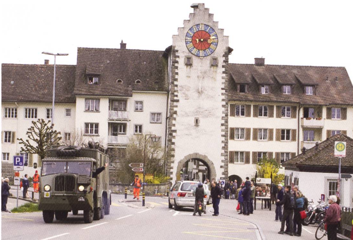
Adieu Stein am Rhein – es war schön!

Für eine Bereicherung des Anlasses sorgte während der Mittagspause die Stadtmusik Stein am Rhein mit ihrem Platzkonzert. Davon profitierte auch die «Museumsbeiz», welche bis auf den letzten Platz besetzt war.