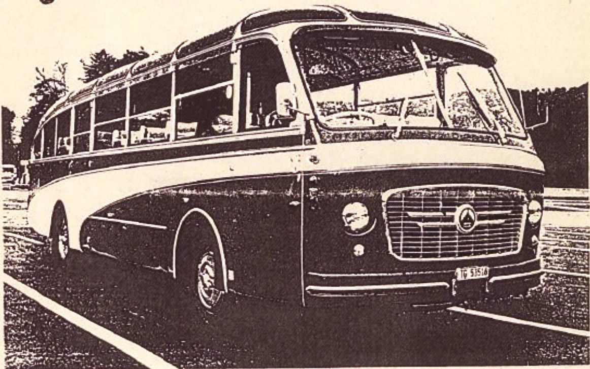
SAURER V 2H Reiseocar