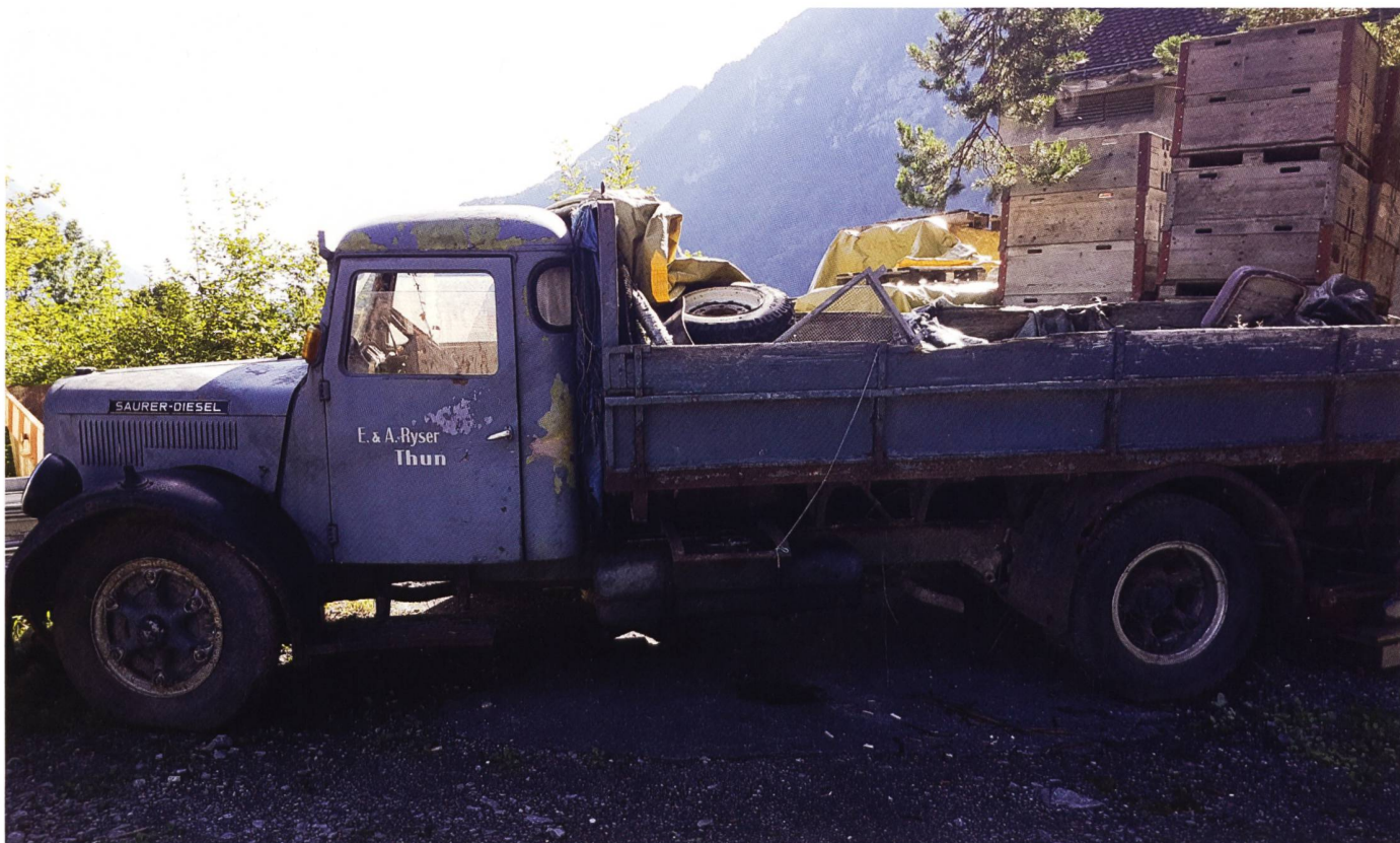
Saurer-Oldtimer, Baujahr 1955

→ es wird finanziell mehr kosten als man sich gedacht hat