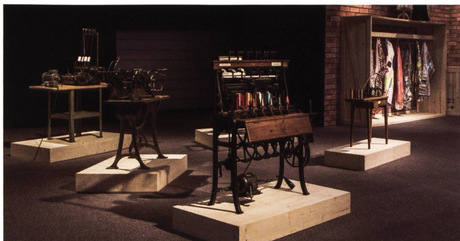
Eine ganz tolle Ausstellung anlässlich Jubiläums-GV der KBSG: Das Saurer Museum zeigt eine Fädelmaschine und einen Spulautomaten: beides aufgebaut und zwei Tage lang vorgeführt von Bert Brunner und Roland Alabor.