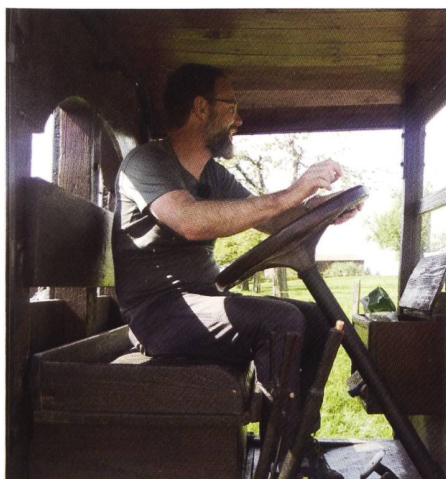
Nik Hartmann hat seit ein paar Monaten das «C-Billet», er darf sich ans Steuer setzen