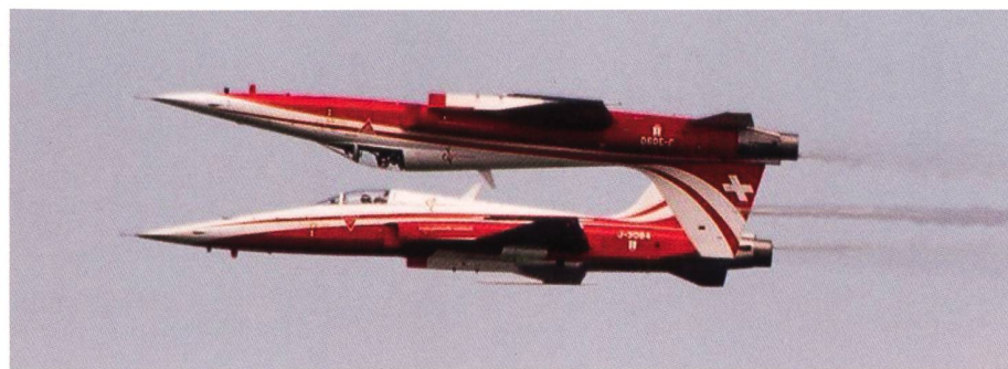
Rücken an Rücken, zwei absolute Kunstflugpiloten.

Dank gutem Wetter war (zum Glück) der Andrang in unserem Museum nicht so gross wie vor vier Jahren, als wir fast überrannt worden waren. Zwei Gruppen hatten extra für diesen Tag Führungen bestellt, sie kombinierten die Führung mit einer freien Besichtigung der Arbon Classics. Gute Idee, zur Nachahmung empfohlen. Viele Einzel- und Gruppenbesucher im Museum, von unseren Fachleuten kundig informiert und begeistert mit Maschinenvorführungen. Hinten bei unserer Motorenausstellung ein besonderer Leckerbissen: Die Stationärmotoren-Vereinigung und die Sulzer-Motoren-Vereinigung zeigten ihre Perlen. Da konnte man vom weit über hundert Jahre alten Petrolmotor Marke Saurer (ev. noch übernommen von Lüdde) bis