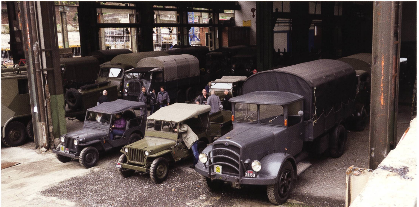
Bereitstellung in der Stahlgiesserei

Text: Hansueli Gräser