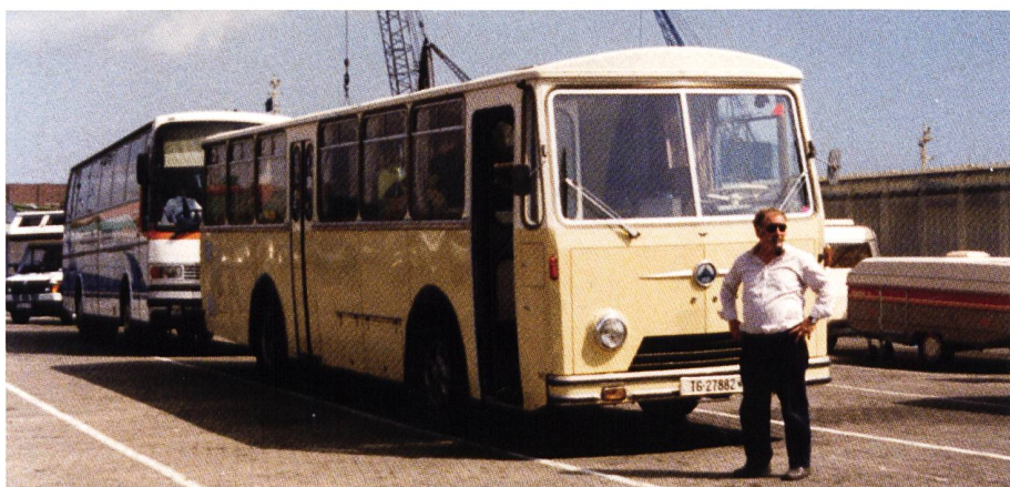
Auf dem Weg nach England

seinen Zwecken zugänglich machen zu können, mussten einige Bedingungen erfüllt sein. «Der Bus sollte eine Hecktüre und einen Unterflurmotor haben, und der Zustand sollte einigermaßen passabel sein», erinnert sich Hansueli Renz. Für ein paar tausend Franken konnte er das Vehikel erwerben.