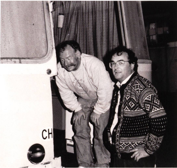
Begutachtung der fertigen Aussparung