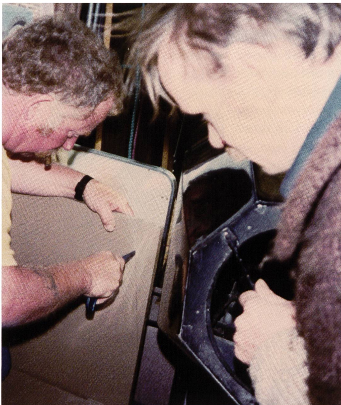
Nacharbeit am Bettgestell

Luxemburg und haben gut 20'000 km zurückgelegt. Pannen: Elektrik beim Schaltgetriebe und einige Gummischläuche, sonst nichts! 1 mal ein Pneu vorne rechts geplatzt auf der Autostrada nahe Parma. Das war aber mein Fehler, ich habe etwas zu tief nachgerillt!»