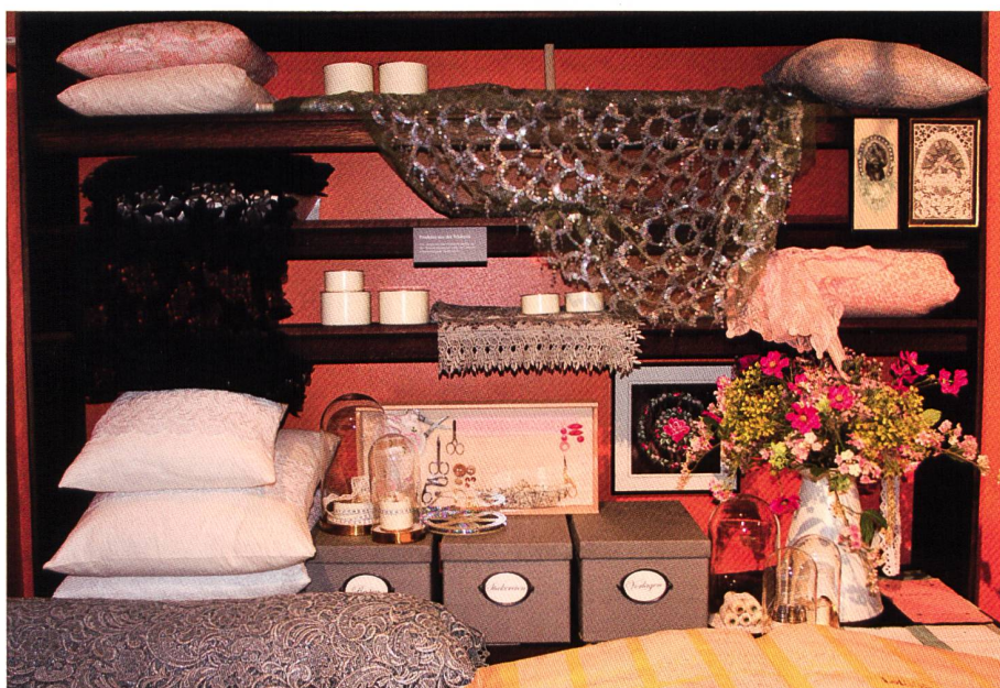
Ein Blick ins neue «Nähkästchen». Weiter Bilder sind auf der Deckseite dieser Gazette zu sehen.