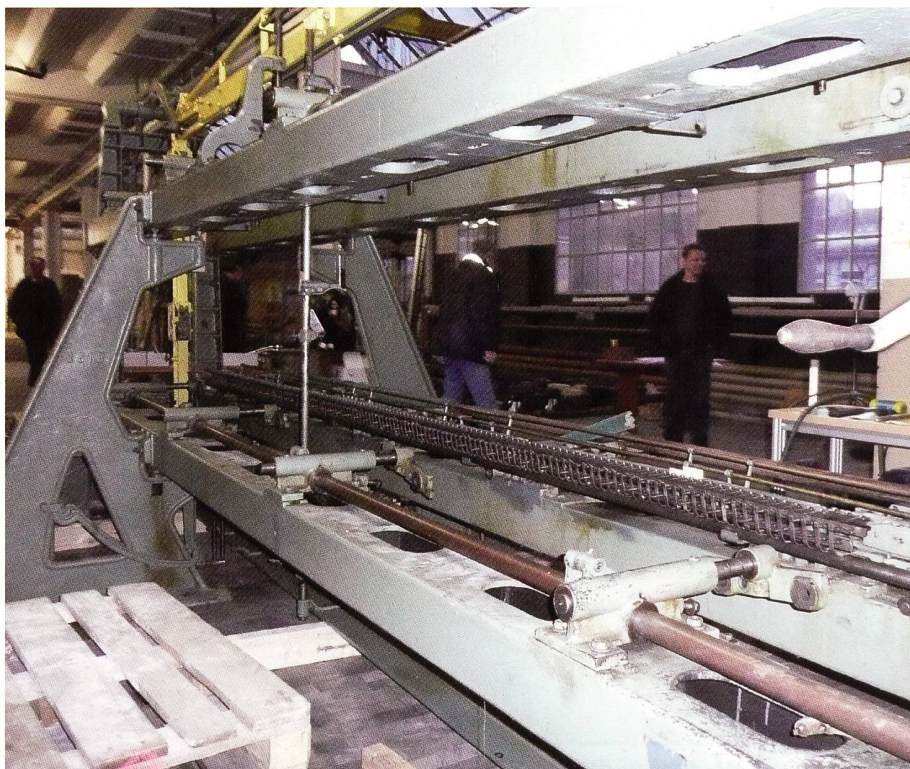
Viele dieser grossen Maschinen wurden verschrottet.

«Der Stickmaschinenbau in Plauen wurde um 1930 eingestellt. Die Firma musste umstellen auf militärischen Fahrzeugbau. Gegen Ende des 2. Weltkrieges wurden die Werke weitgehend zerbombt. In den 75 Tagen Besatzungszeit der US-Armee in Plauen vor Übergabe des Gebietes Anfang Juli 1945 an die alliierte Macht aus Moskau wurde das gesamte Werksarchiv und die vorgefundenen Baugruppen, u.a. aus dem Panzerbau, in die USA verbracht. Anschliessend beschlagnahmten die russischen Besatzer die Überreste der Fertigungsmaschinen. Die Fertigung wurde nie mehr aufgenommen.»