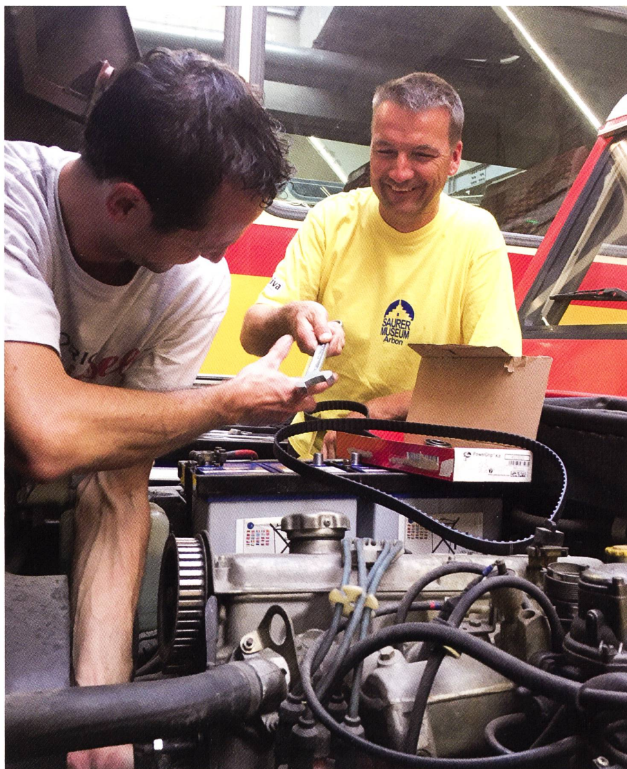
«Gib mir gschwind der 24er-Schlüssel»; Hand in Hand wird gearbeitet am Feuerwehr-«Jeep».

Sein nächstes Zukunftsprojekt ist die fachgemässe Restauration vom «Fülle-mann», dem sehr speziellen Baustellenfahrzeug der letzten Generation. Und sein Traum ist die Wiederherstellung des