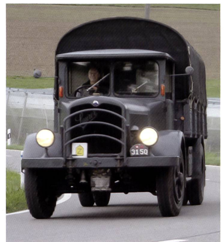
Saurer BLD in voller Fahrt