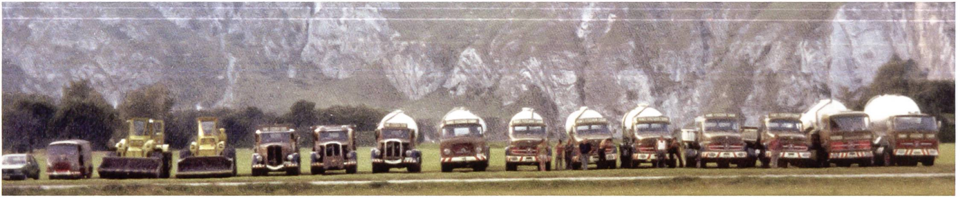
Fototermin der Fischerflotte 1974 auf dem Rossboden in Chur. Neben 4 SAURER stehen 6 Mercedes und 1 Henschel LKW.

SAURER-Kipper werden für Aushub und Schüttguttransporte eingesetzt.