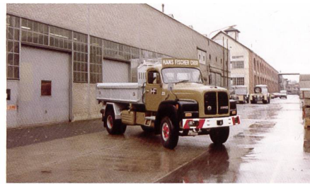
Der letzte SAURER D290B stand während 26 Jahren im Einsatz.

290 PS, WSK 8 Ganggetriebe, v_{max} (nicht plombiert) 128km/h!! Dazu ein superguter Innenretarder (im Getriebe!), der das Fahrzeug auf 20km/h verzögert. Dieser letzte Fischer-SAURER ist noch länger im Einsatz als der V8 1958. Erst 2008 wird er durch einen Mercedes-Benz 5-Achser ersetzt, nach 26 Jahren im Einsatz, davon die letzten 18 Jahre als Pflugwagen auf der A13 zwischen Chur und Reichenau. Auch dieser letzte SAURER wird revidiert und ist Teil der Fischer-Oldtimerflotte.