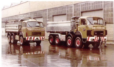
SAURER 3-Achser 330D 1973 und SAURER 4-Achser 330B 1976

SAURER-Kipper werden für Aushub und Schüttguttransporte eingesetzt.