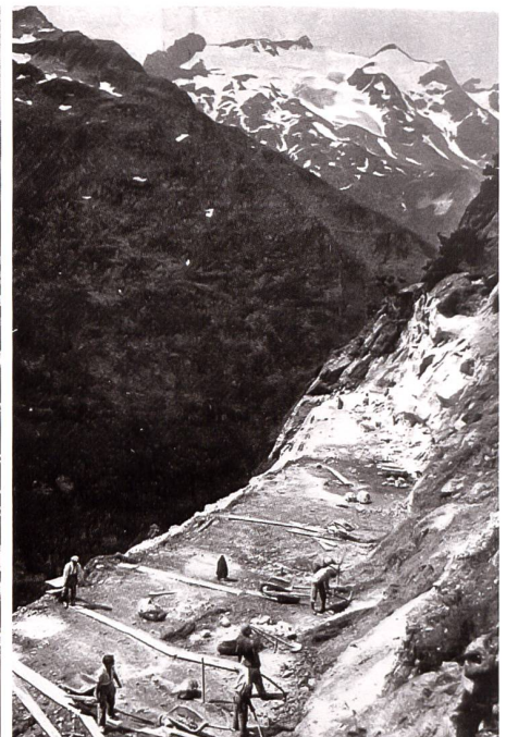
Strassenbau zwischen «Himmel» und Obertal. Giglistock.