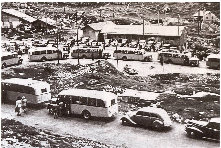
Jedermann will dabei sein an der Eröffnung der neuen Sustenstrasse. Eröffnungsfahrt am 7. September 1946