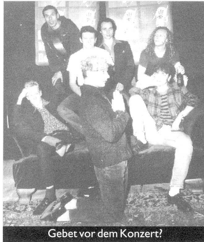
Gebet vor dem Konzert?

Wir hatten die Aufnahmen für unsere erste CD fertig gemixt und waren auf dem Sprung nach Bern an das erste Wettrennen der Töne. Ich hatte unsere Kassette eingeschickt und uns angemeldet. Nie hatte ich mir Gedanken darüber gemacht wie weit der amerikanische Imperialismus mit unserer Musik oder meinem Gesang verknüpft ist. Nicht mal bei Magenbeschwerden trinke ich Cola, und ich bin aus Überzeugung Nichtraucher. Ausserdem war und bin ich extremer "Neue Deutsche Welle"-Fan. Etwas vom Besten