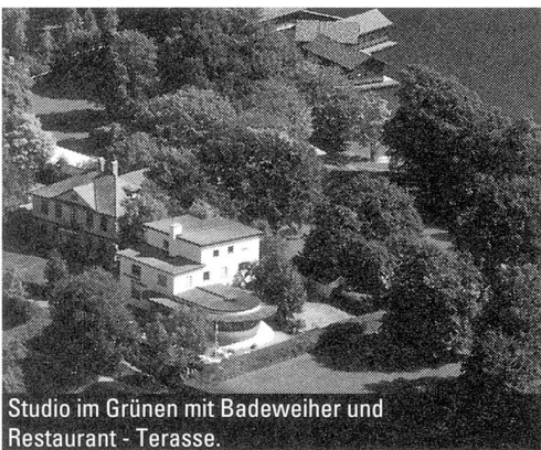
Studio im Grünen mit Badeweiher und Restaurant - Terasse.