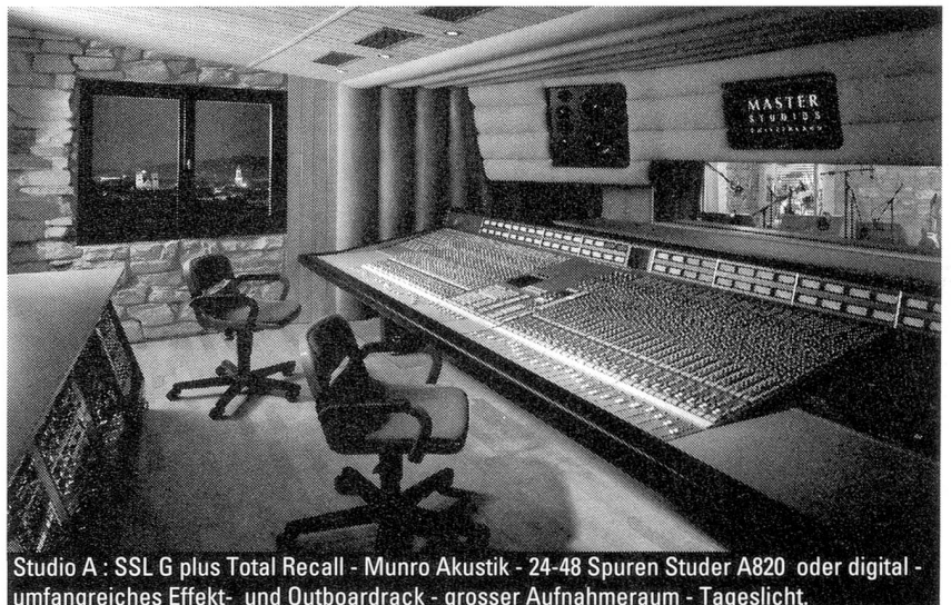
Studio A : SSL G plus Total Recall - Munro Akustik - 24-48 Spuren Studer A820 oder digital - umfangreiches Effekt- und Outboardrack - grosser Aufnahmeaum - Tageslicht.